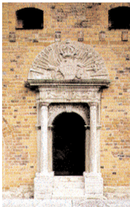
Portalen till krigsmanshuset som inrättades på 1640-talet i nunneklostret sedan klostret stängts definitivt 1595 och byggnaderna dragits in till kronan.