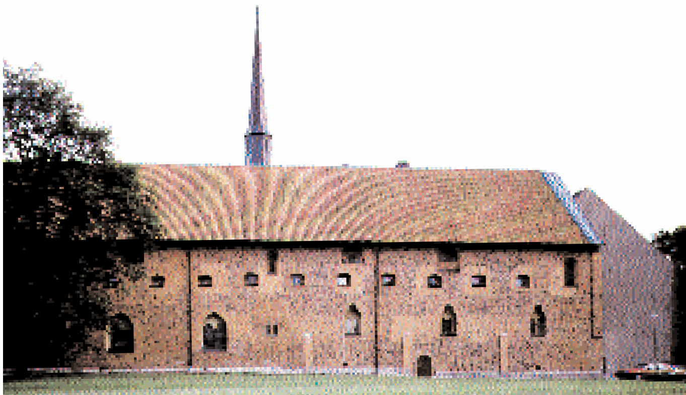
Birgittinklostret i Vadstena uppfördes under 1370-talet på platsen för Vadstena kungsgård. Folkunga-/Bjälboättens palats från 1200-talet finns ännu bevarad i nunneklostrets norra länga.