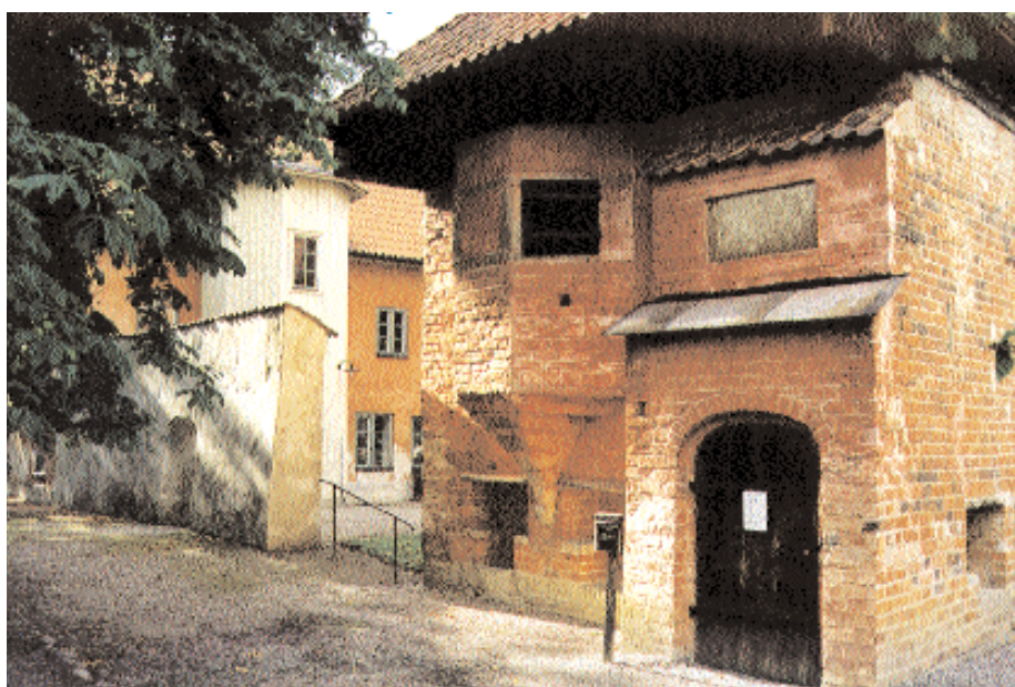
Mårten Skinnarens hus är ett av landets bäst bevarade exempel på senmedeltida bostadshus. I bakgrunden Stora dårhuset från 1757.

successivt kom att förlora inflytande. Det är också känt att kungen 1528 tog biskopshuset i Vadstena i anspråk för eget bruk. Biskopshuset blev sedan kyrkoherdeboställe genom en kunglig donation senare under seklet. Trots förändringarna kom Vadstena kloster dock att arrendera sina forna gods fram till 1540-talets mitt, då de slutgiltigt drogs in till kronan.