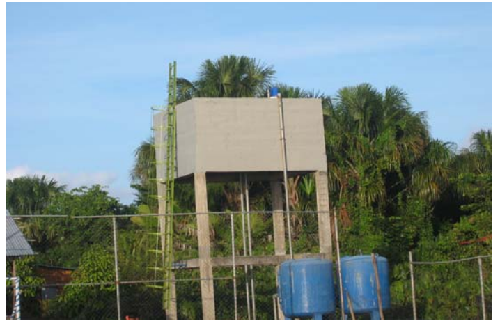
Foto 8. Tanque de agua de Bonoína