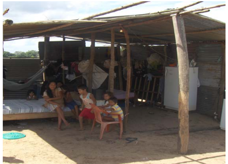
Foto 4. Vivienda de Yamusal

viviendas se pueden observar neveras, lavadoras, cocinas, televisores, DirecTV, y equipos de sonido, entre otros electrodomésticos menos comunes como licuadoras, por ejemplo.