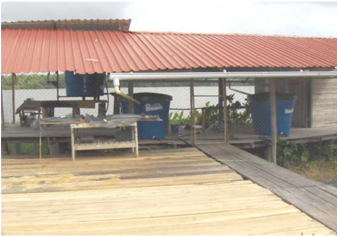
Foto 7. Planta experimental de potabilización de agua en Muaina