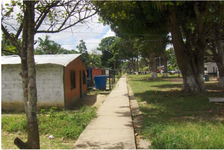
Foto 1. Viviendas de El Moriche