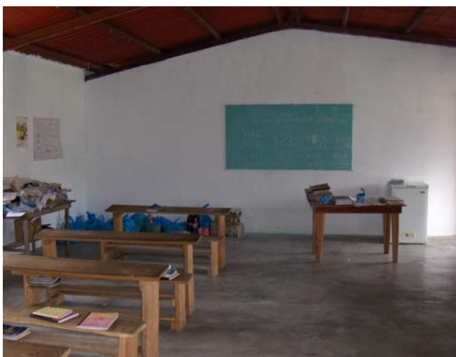
Foto 16. Escuela de Diarukabanoko