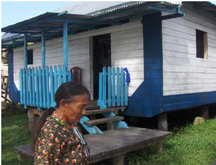
Foto 3. Vivienda en Nabasanuka