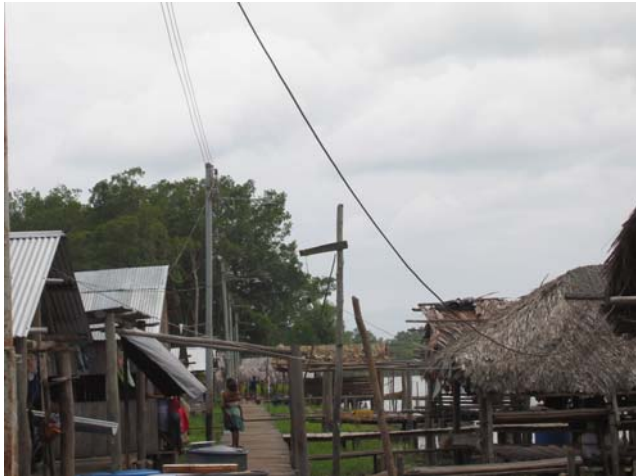
Foto 9. Tendido eléctrico en Morocoto