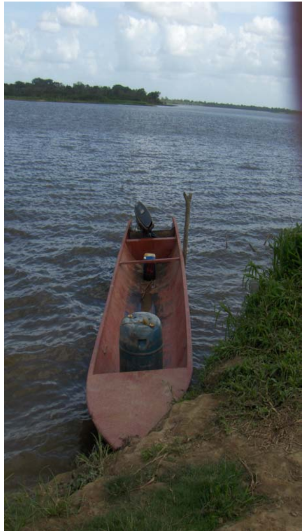
Foto 11. Único transporte en Boca de Latal