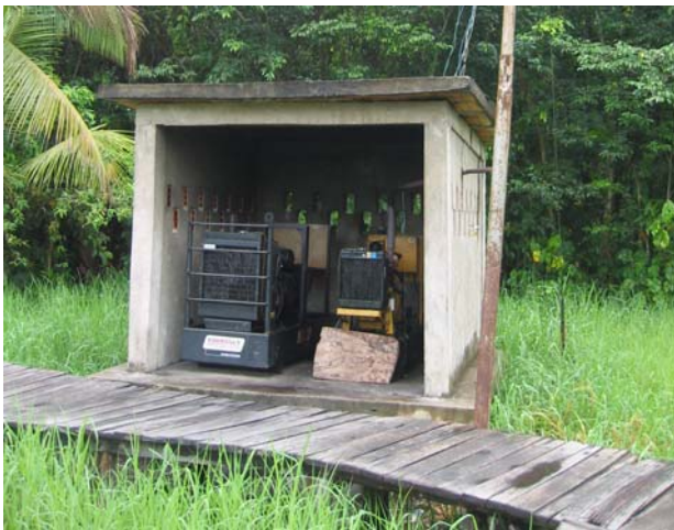
Foto 10. Planta comunal de Winamorena