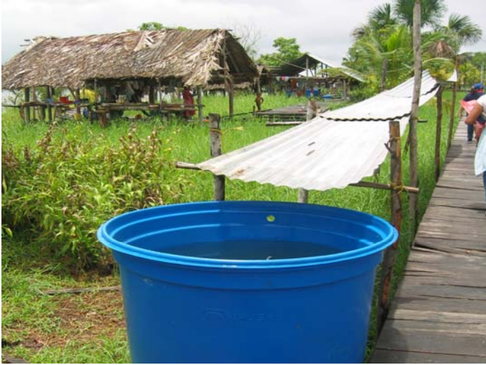
Foto 5. Recolecta de agua de lluvia en Winamorena