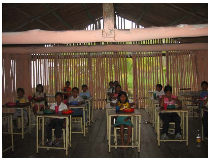
Foto 15. Escuela de Isla Misteriosa