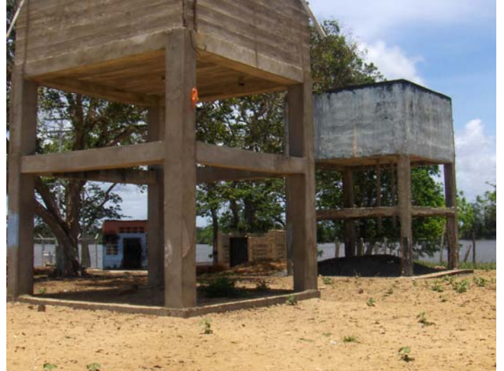
Foto 6. Tanque de agua abandonado sin terminar en Pueblo Blanco