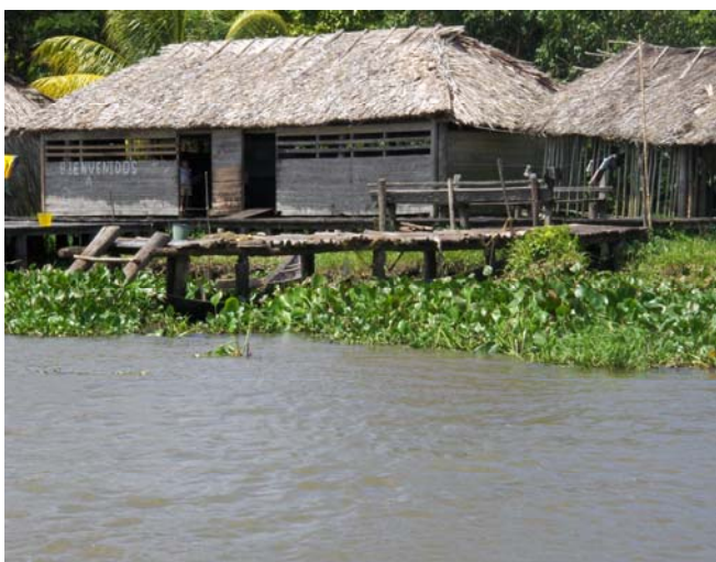
Foto 14. Escuela de Sakoinoko

colares 2006-2007 (con 89 escuelas) y 2007-2008 (con 82 escuelas); hay escuelas asignadas a parroquias y municipios diferentes en uno y otro año; y en algunos casos la matrícula no figura en los listados administrativos. Además, puede pensarse que la matrícula de los planteles indígenas comprende elementos criollos en algunas escuelas.