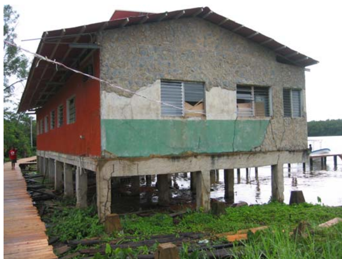
Foto 17. Escuela de Winamorena II