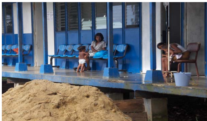
Foto 12. Centro de de salud integral de Nabasanuka