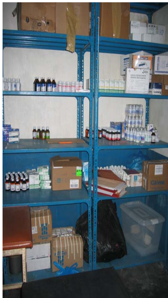
Foto 13. Dispensario médico de Wakajara

beo del agua de río, continúa con la coagulación, floculación y sedimentación, prosigue con una filtración rápida ascendente y termina con la cloración, almacenamiento y distribución del agua directamente a cada uno de los janoko o viviendas de un asentamiento. Para el mantenimiento y funcionamiento adecuado de este sistema de potabilización, se han creado talleres y manuales para la comunidad. El programa piloto fue instalado en Muaina.