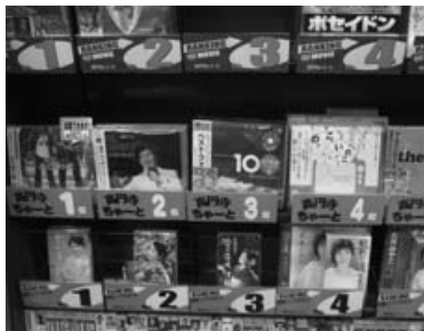
高円寺レコードオリジナルのチャートでアピール