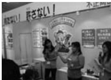
フェスティバルの様子

「だめだめ!不正商品には気をつけて!~不正商品は、買わない!持たない!許さない!~」をテーマに、ブース出展しております。