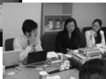
MPA対象のセミナーの様相