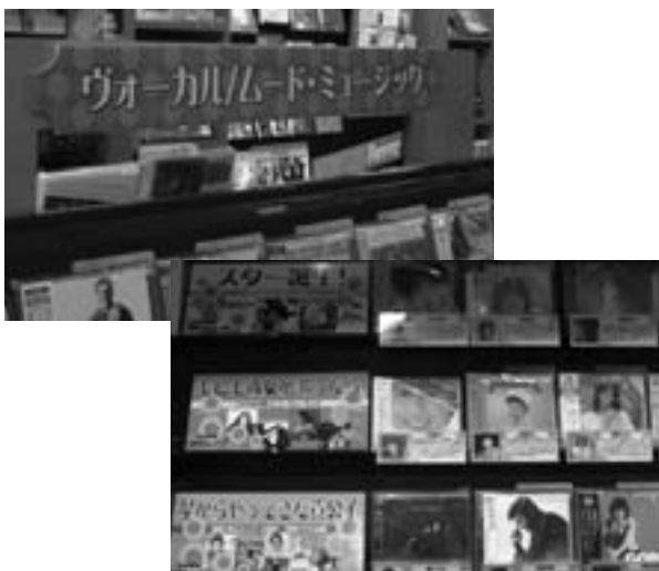
個性的なジャンル別でお客をひきつける

また当店の強みは、各アーティストを総合的にカバーするラインアップに加え、新星堂の店舗ネットワークを使えるところです。在庫を調べて、全国どこからでも取り寄せることができます。たとえば、岡山県の店舗に1枚だけあった、という商品を取り寄せたこともあります。