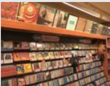
壁上部には懐かしのLP

「高円寺レコード」は、シニア世代にアピールする懐かしい店を目指して、新星堂が立ち上げたコンセプトショップである。歌謡曲、ダンス音楽、ジャズ、ロック、そしてフォーク懐かしの旧譜をラインアップした専門店として、開店以来じわじわと知名度を上げ、幅広いエリアからシニア世代の男性客を中心に顧客を集めている。土日は特に賑いを見せるそうだ。最も空いている時間ということで、平日の午後を訪れたが、来客の途絶えることはほとんどなく、恐縮しながらの取材となった。