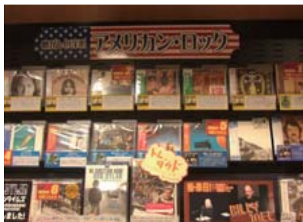
商品の陳列や紹介のコメントにもこだわり

もともと高円寺は、新星堂の第1号の店舗が出店したところであり、昔からのなじみのお客様もたくさんいらっ