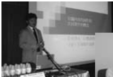
香港税関対象のセミナーの様相

CODAおよびCJマーク委員会ではこのようなトレーニングセミナーを通じて、中国における日本コンテンツの海賊版対策に積極的に取り組むとともに、アジアにおけるCJマークの普及促進に寄与していく予定です。