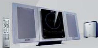
28x mikrověž s DVD