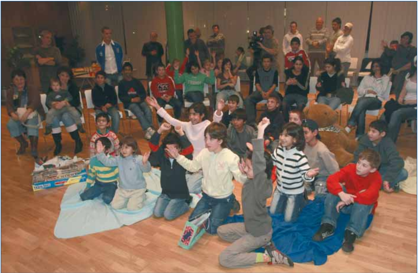
Předvánoční akce o.s. Peppermintu pro děti z dětských domovů