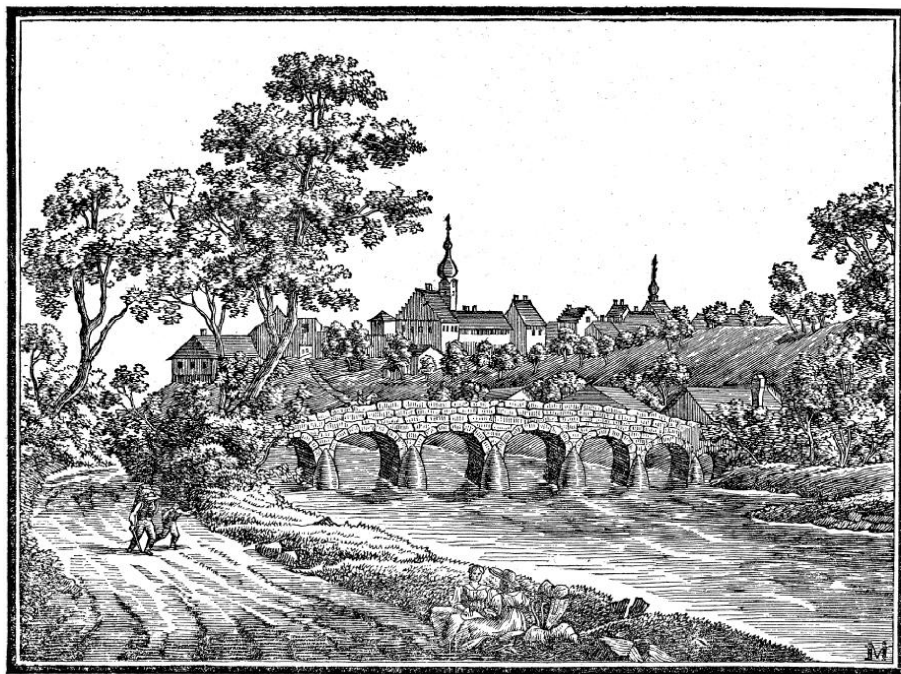
Thurbrücke und Stadt Bischofszell von Südwesten um 1827. Am rechten Brückenende Dach des 1860 abgerissenen Thurbades. Holzstich nach J. B. Isenring.

Da die krumme Brücke 1969 für den motorisierten Verkehr gesperrt wurde dank einer neuen Thurbrücke weiter flussabwärts, erfuhr sie von 1971 bis 1975 eine totale Sanierung. Das gab 1974 Gelegenheit, die Reste des im 17. Jahrhundert erwähnten Badehauses archäologisch zu untersuchen. Dabei entdeckte man eine grosse Eichenholzwanne, Teuchelleitungen und Badeöfen. Eine umfassende Instandsetzung drängte sich von 1999 an auf, bei der Teile der Sandstein- und Tuffsteinquader ersetzt und die Fahrbahn gegen Nässe abgedichtet wurden. 2006 wurde die Sanierung abgeschlossen.