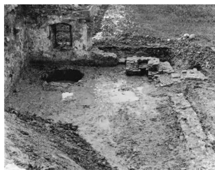
Ehemaliges Thurbad 1974 mit Wanne und Ofen.