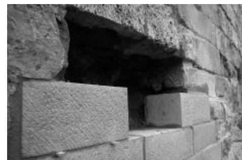
Ersatz beschädigter Steine.