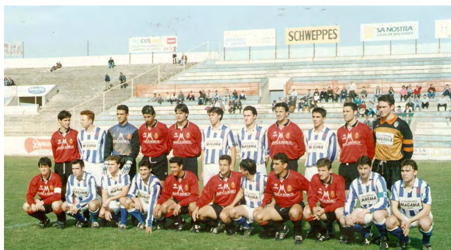
28 de març de 1993. 50è aniversari de l'Atlètic Baleares.