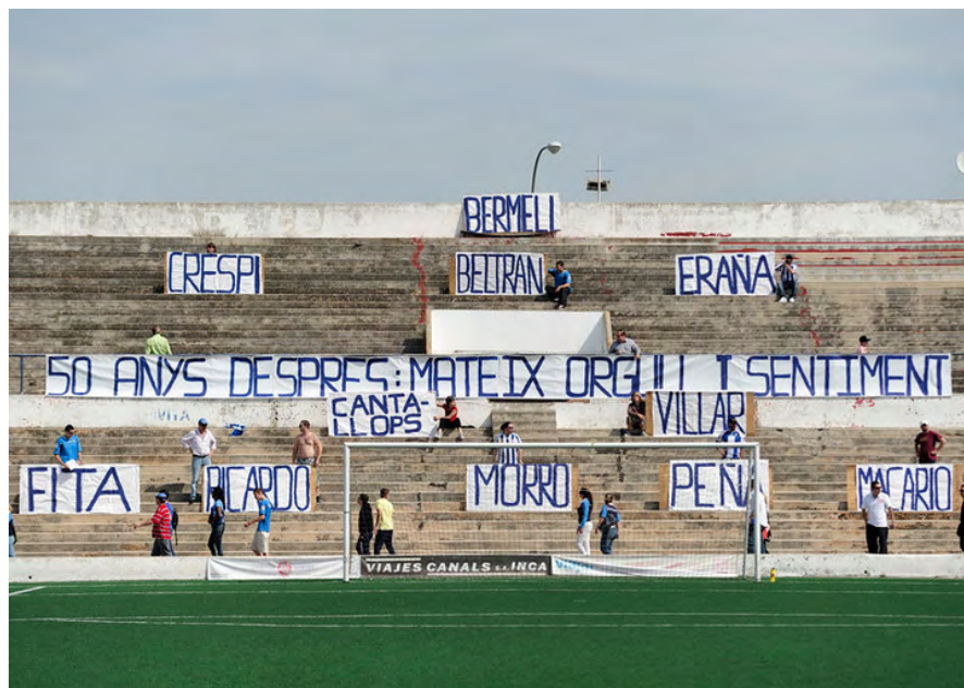
Emotiu record pels jugadors que el 8 de maig de 1960, inauguraren l'Estadi Balear