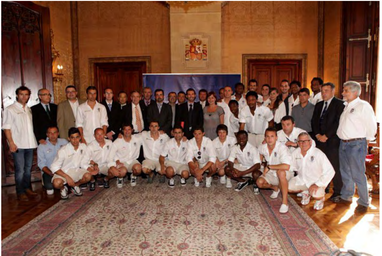
La presidenta del Consell Insular de Mallorca, Francina Armengol, amb la directiva, cos tècnic i jugadors de l'Atlètic Balears