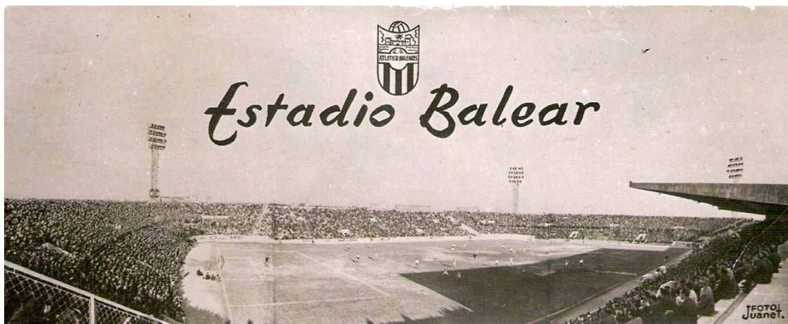
16 d'abril de 1961. Atlètic Balears - Constància