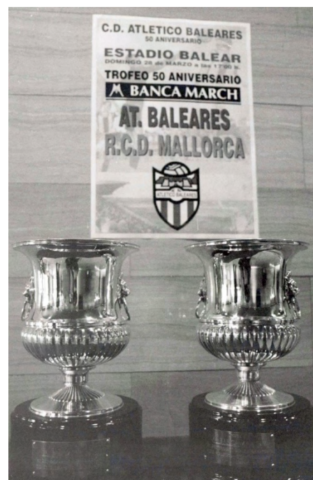
Cartells anunciadors dels actes commemoratius del 50è aniversari de l'Atlètic Baleares