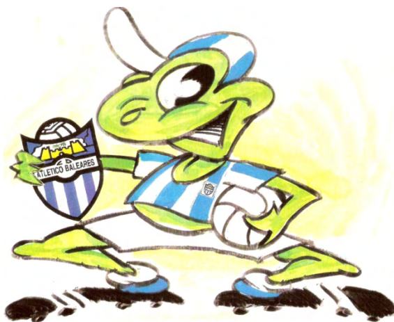
El Ferreret, mascota oficial de l'Atlètic Balears Dibuix original d'Antoni J. Bibiloni Palmer, Bibi

Atlètic, Atlètic, oe, oe, oe. Atlètic, Atlètic, oe, oe, oe. Atlètic, Atlètic, l'Atlètic és el millor.