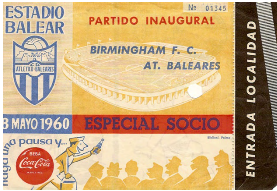
Entrada del partit inaugural de l'Estadi Balear