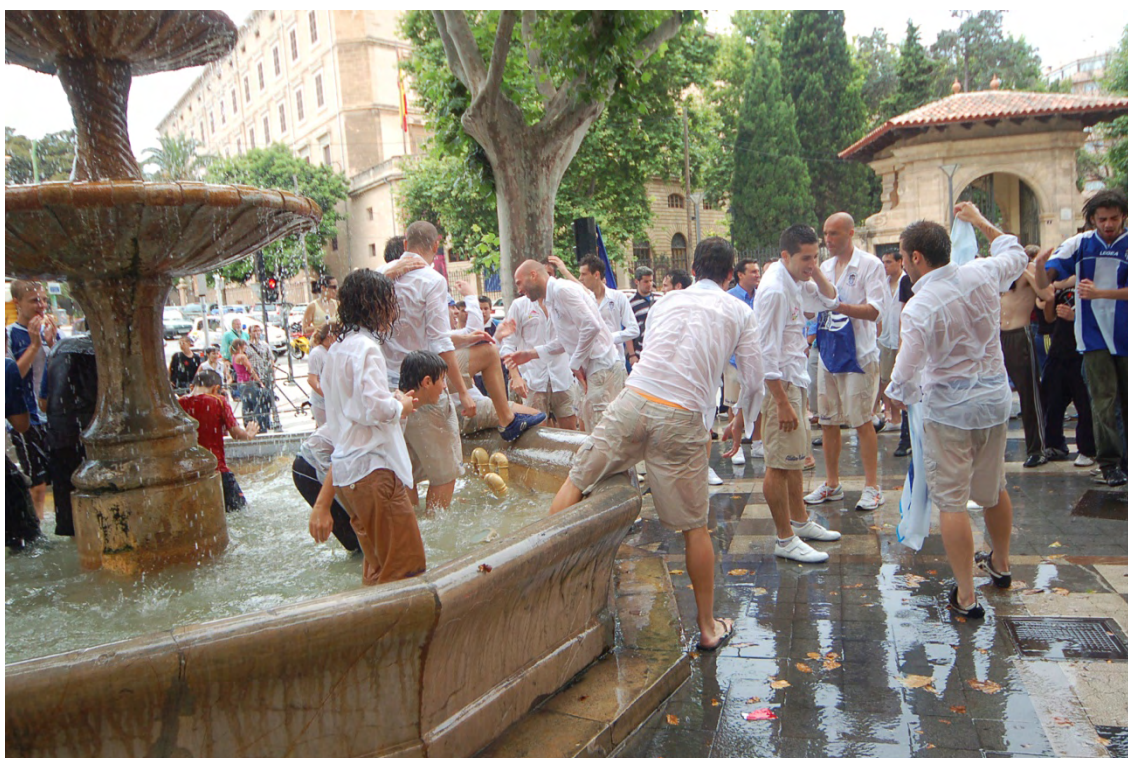
El vell brollador de la Rambla testimoni de l'alegria de jugadors, directius i seguidors blanc-i-blaus