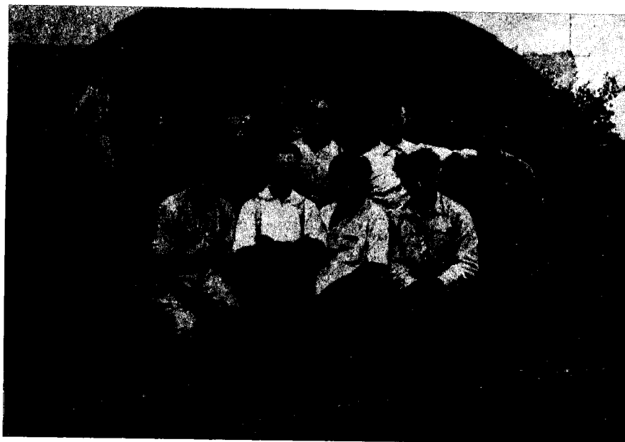
חברי קבוצת 'השרון' ב'גדוד המצרי'

בהגיעם ארצה נכנסו אנשי החבורה להסתדרות הכללית כחברי 'הפועל הצעיר' והשתלבו ברוח הכללית של חלוצי העלייה השלישית. במהרה החלו לקיים פגישות בפוריה, 14 משום שאלוהי בן-חורין — הדמות המרכזית בחבורה שעוד נרחיב עליו את הדיבור — עבר עם קבוצת 'השרון' ליבנאל. בפוריה הם פגשו אף בחברים נוספים מקבוצת 'השרון', אותם כבר הספיק בן-חורין לצרף ל'מפעל', חבורתו הסודית.