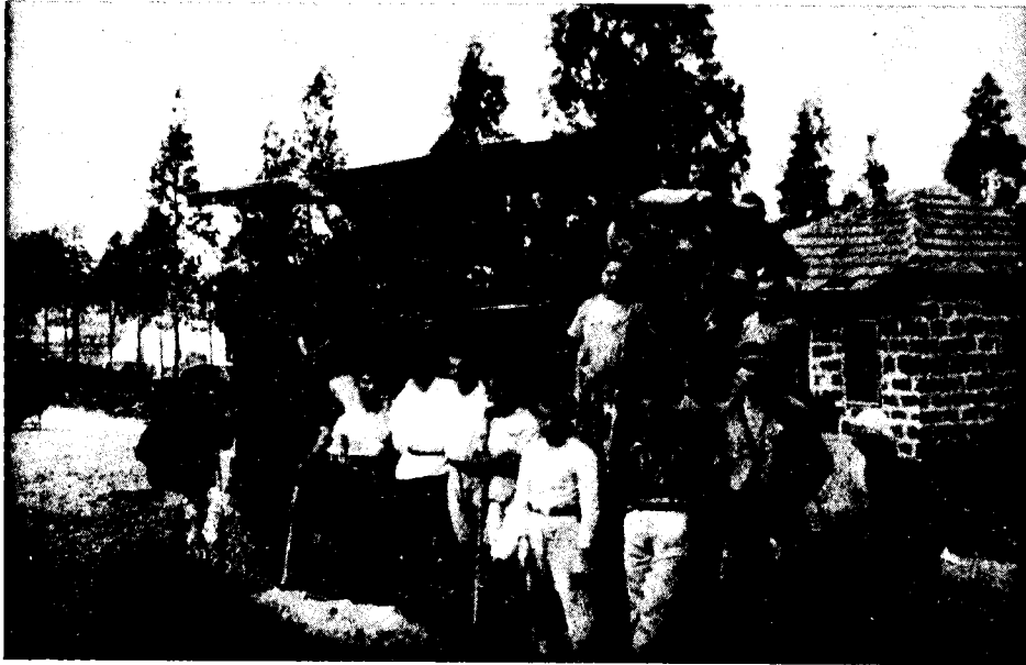
חברים מקבוצת 'השרון' במחנה הסוללים בכביש עפולה-נצרת