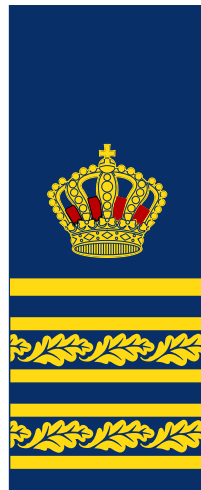
7 Polis-/Kriminalkommissarie med särskild tjänsteställning