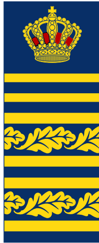
2 Överdirektör, Chefen för polisavdelningen vid Rikspolisstyrelsen, Rikskriminalchef, Länspolismästare i Stockholms län, Västra Götaland och Skåne