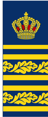
3 Länspolismästare utom i Stockholms län, Västra Götaland och Skåne, biträdande Länspolismästare i Stockholms län, Västra Götaland och Skåne