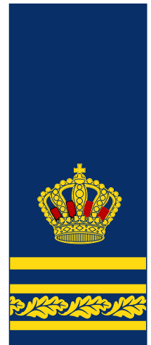
9 Polis-/Kriminalinspektör med särskild tjänsteställning