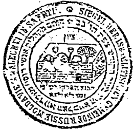
חותם 'מקהלות אנשי רוס' מאלדווא וואלכייא הי"ו בעיר הקודש צפת תובב"א'