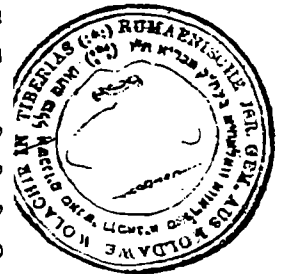
חותם 'כולל אשכנזים מאנשי רומאניא מאלדאווא וואלאחיא בעיה"ק טבריא ת"ו'