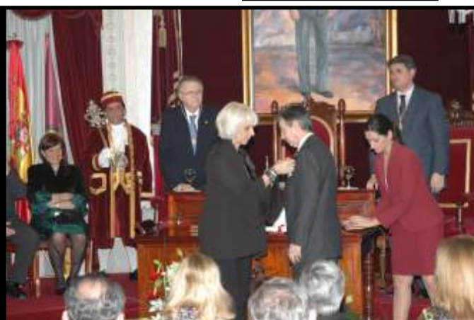
Entrega de la Medalla de Oro - 26 de Enero de 2010