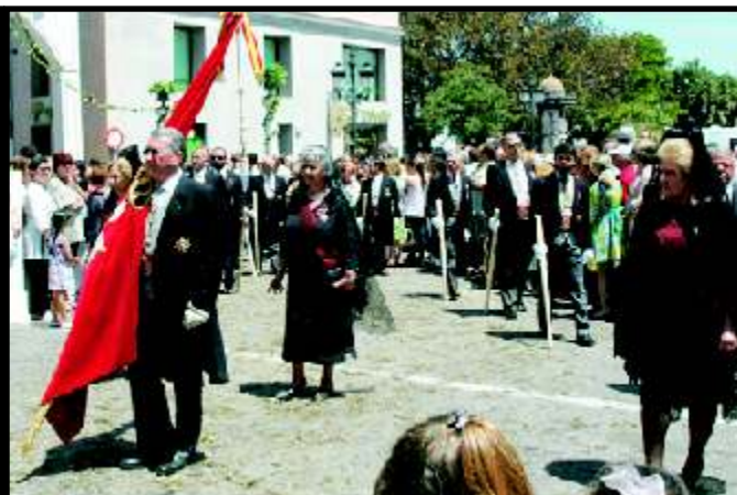
Corpus en Cádiz - 6 de Junio de 2010