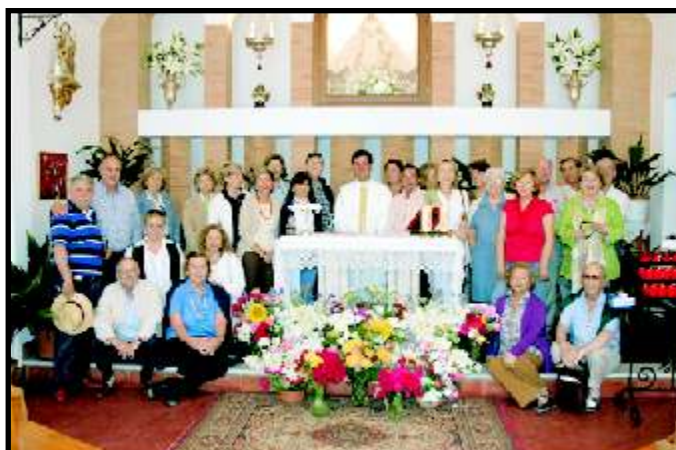
Excursión a Grazalema - 29 de Mayo de 2010