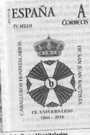
Sello y postal del Nazareno y sello de Caballeros Hospitalarios.

Timbre - una tarjeta postal, reproduciendo tanto el sello como la postal la imagen de la Virgen de los Dolores. La corporación de Santa María pondrá a la venta el sello (al precio de 1,5 euros) y de la postal (a 3 euros cada unidad) durante los próximos viernes.