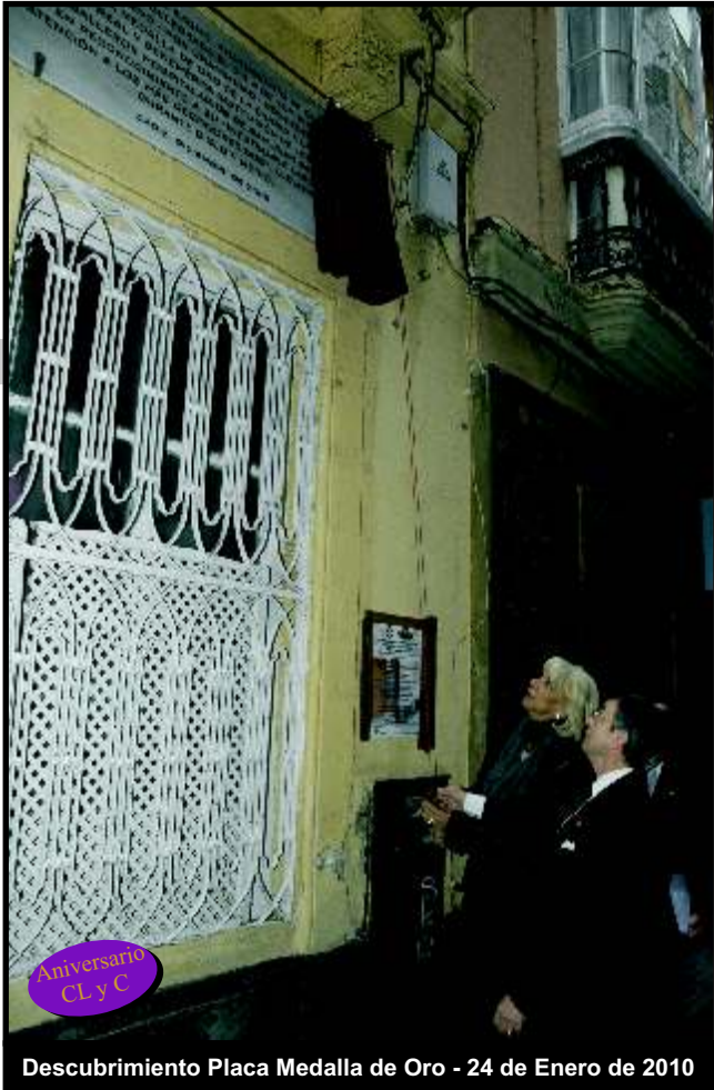
Descubrimiento Placa Medalla de Oro - 24 de Enero de 2010