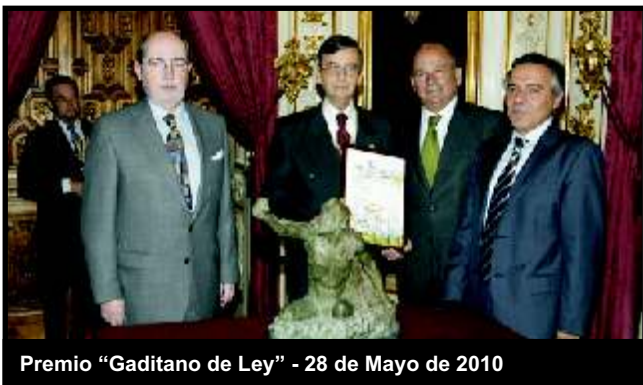
Premio "Gaditano de Ley" - 28 de Mayo de 2010