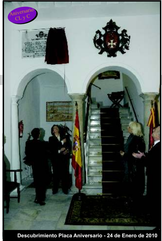
Descubrimiento Placa Aniversario - 24 de Enero de 2010