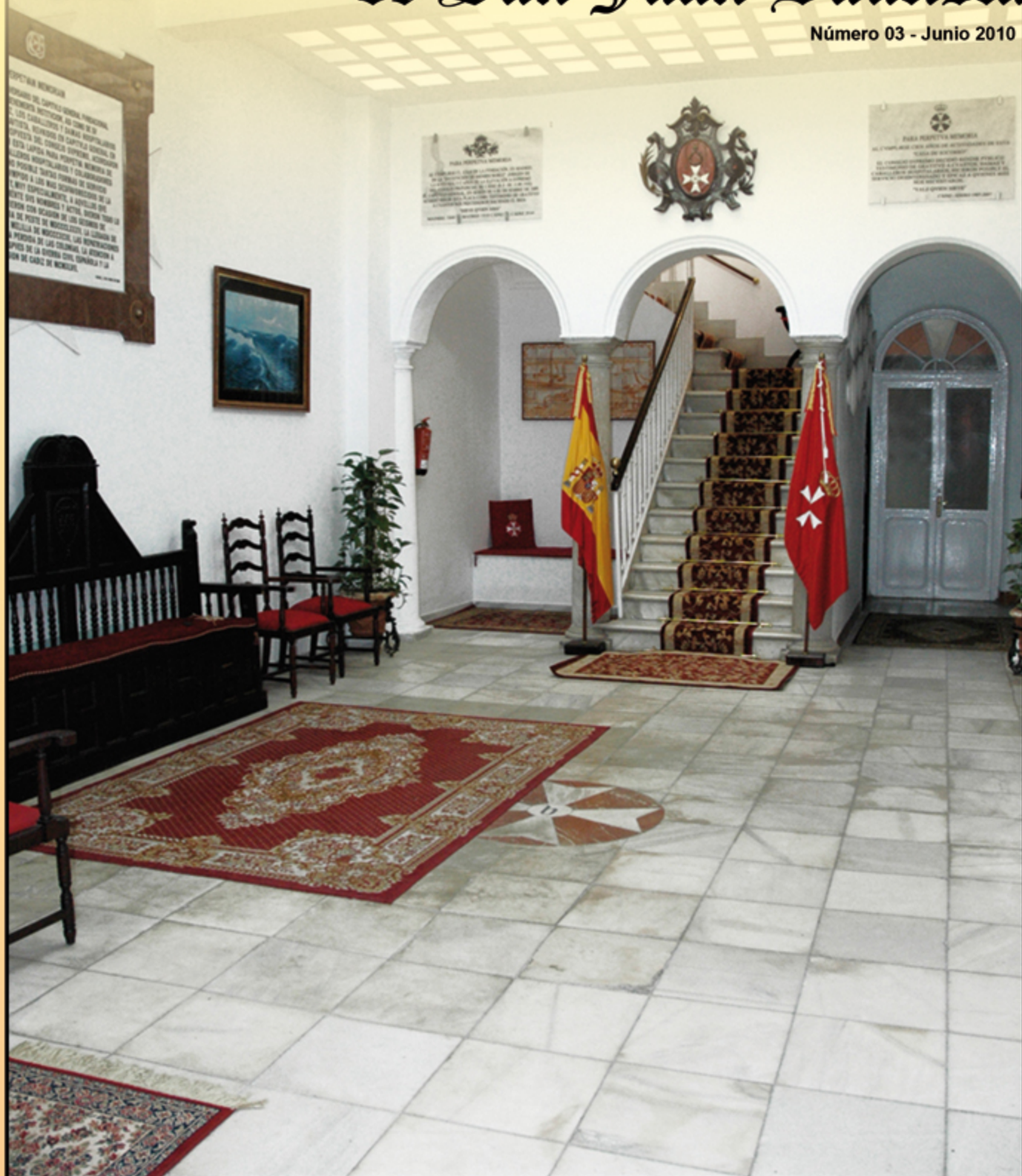
Escalera Principal de la Sede