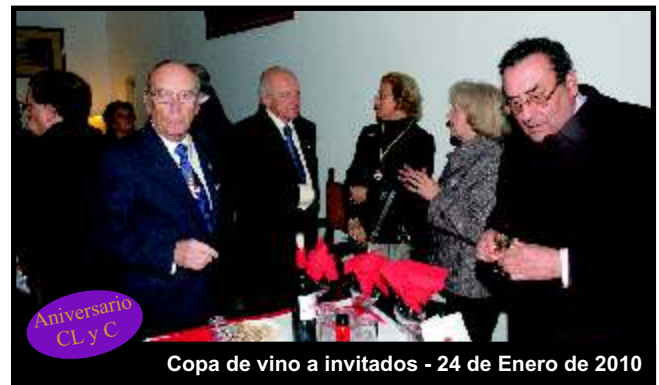
Copa de vino a invitados - 24 de Enero de 2010