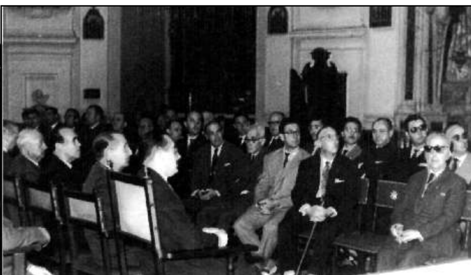
24 de Junio de 1961 Festividad de San Juan Bautista . Capítulo General