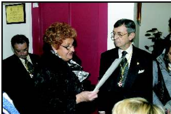
Inauguración Ascensor - 24 de Enero de 2010