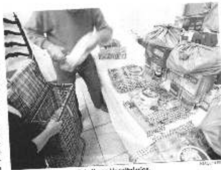
Lotes de alimentos en Caballeros Hospitalarios.

Rocho comentó ayer que el primer reparto después del fin de los últimos meses había sido "apabullante". Caballeros Hospitalarios atendió a unas 130 personas, una cifra que dobla a los re-