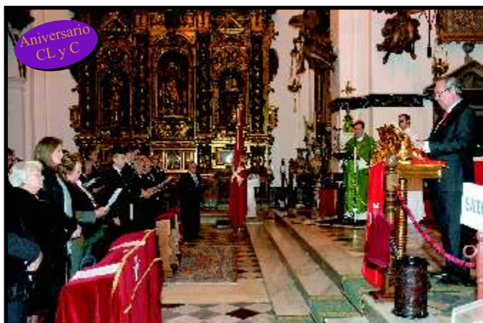
Misa de Acción de Gracias - 24 de Enero de 2010