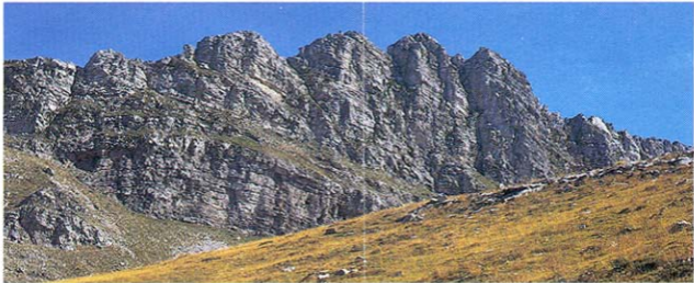
Bouvo Xarzi (2038m) / Chatzi mountain