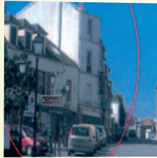
Illustration par commune

• Bièvres : 4 rue de Paris. Un programme de 4 logements sociaux en acquisition/ amélioration d'une construction existante.