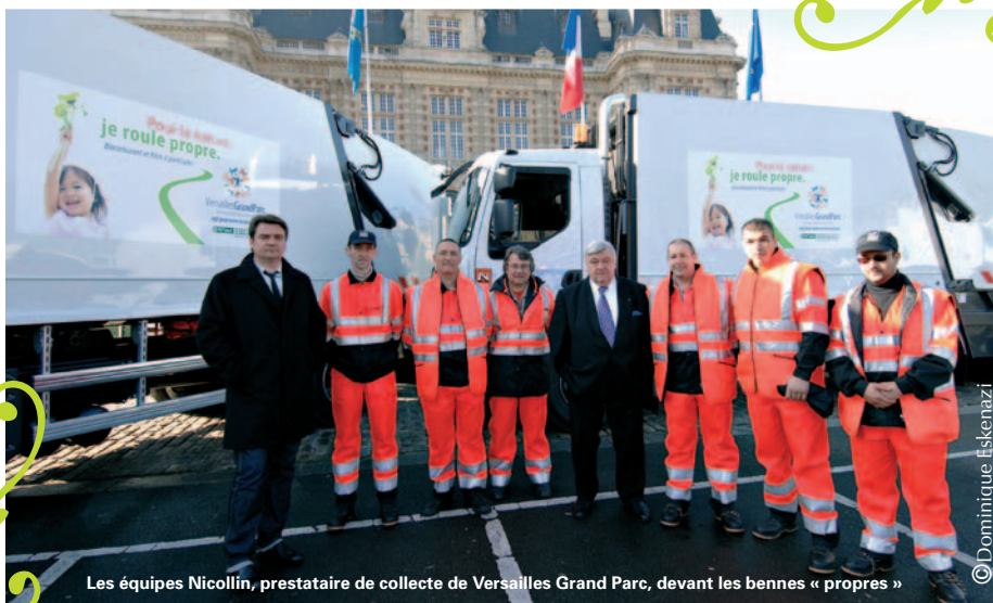
Les équipes Nicollin, prestataire de collecte de Versailles Grand Parc, devant les bennes « propres »

NOS SERVICES SE TIENNENT À VOTRE DISPOSITION : 01.30.83.03.10.