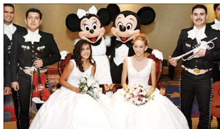
MIXTO. Ellas eligieron a Mickey y Minnie, pero también a los mariachis.

En Disneyland Resort es una tradición festejar los 15 con las princesas de los cuentos. Se puede elegir entre dos opciones: el baile soñado o unas vacaciones familiares. El baile es "digno de una princesa" aseguraron los representan-