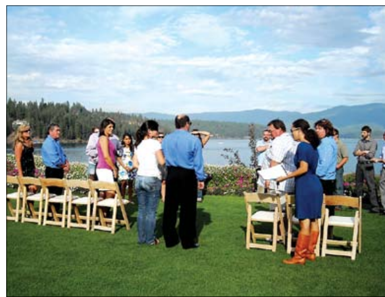
FILA. Las damas y caballeros de honor con la organizadora (vestido azul).