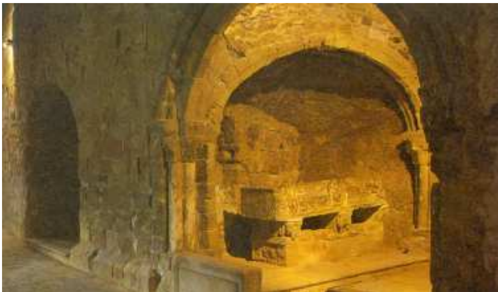
Sepulcro de San Millán (siglo XII) en el monasterio de Suso (La Rioja).

Conviene recordar que entre ambos hermanos se había repartido el gran condado materno de Castilla, dependencia tradicional del reino leonés, y que la muerte de Vermudo III había convertido ahora a García por parte de su herencia castellana en teórico vasallo de su hermano menor. El monarca pamplonés interpretó probablemente estos dominios condales como una extensión de su propia órbita de soberanía y encomendó en ellos algunos distritos ("mandaciones") a caballeros del círculo nobiliario de Pamplona en detrimento, por tanto, de la aristocracia local, algunos de cuyos miembros tenían intereses también en los dominios de Fernando. Quizá trató igualmente de reforzar su autoridad mediante una reorganización eclesiástica de la zona pues, aunque mantuvo el obispado de Álava, suprimió el de Valpuesta y afilió sus iglesias al de Nájera-Calahorra (1052). La expansión en la misma dirección del dominio del monasterio de San Millán de la Cogolla sugiere análoga intencionalidad política.