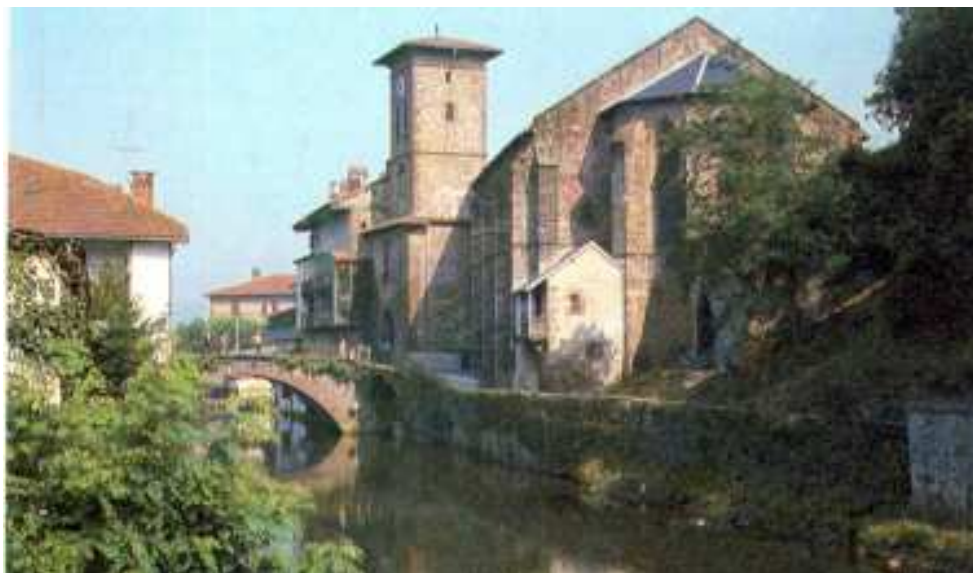
Saint-Jean-Pied-de-Port (Baja Navarra).

Después de una larga guerra sin cuartel fue desmantelada la resistencia aquitana hasta sus últimos confines pirenaico-occidentales (768) y en los comienzos de su reinado pudo encomendar Carlomagno el gobierno de los diferentes condados de la región a miembros de las aristocracias locales de su mayor confianza. Seguramente magnates resentidos por este reajuste debieron de atizar el descontento de gentes habitualmente levantiscas, como los Vascones de los recónditos valles pirenaicos que habrían aniquilado en la llamada batalla de Roncesvalles la retaguardia del gran ejército que había conducido el propio Carlomagno hasta los muros de Zaragoza (778).