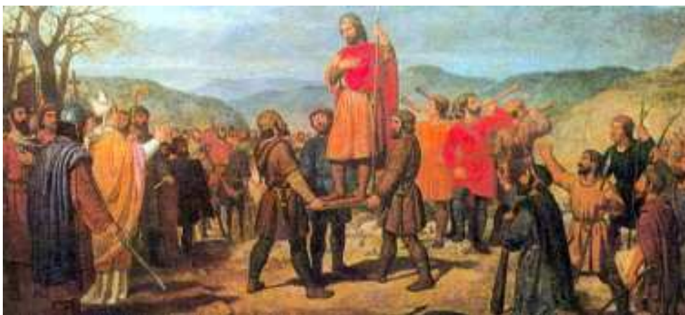
Azamiento idealizado del primer rey pamplonés, obra de Joaquín Espalter. Salón del Trono del Palacio Foral de Navarra.

En rigor sólo se sabe con certeza que el primer rey pamplonés en sentido estricto nació de las segundas nupcias de un García Jiménez con Dadildi, hermana del conde Raimundo de Pallars-Ribagorza. En las llamadas “Genealogías de Roda”, recopiladas por voluntad sin duda de Sancho Garcés II (970-994), no se remonta más atrás su ascendencia. Si entonces se silenciaron anteriores eslabones familiares, parece que no hay razón suficiente para imaginarlos más o menos ingeniosamente. Más que por línea paterna, se prefirió resaltar el lustre y la antigüedad de la dinastía reinante por el linaje de la esposa de Sancho Garcés I, Toda, tataranieta de Íñigo Arista, y, de otro costado, por la estirpe de Andregoto, mujer de García Sánchez I (925/931-970), hijo y sucesor del propio Sancho Garcés I, y tataranieta a su vez tanto del conde Aznar Galindo I de Aragón como de Íñigo Arista.