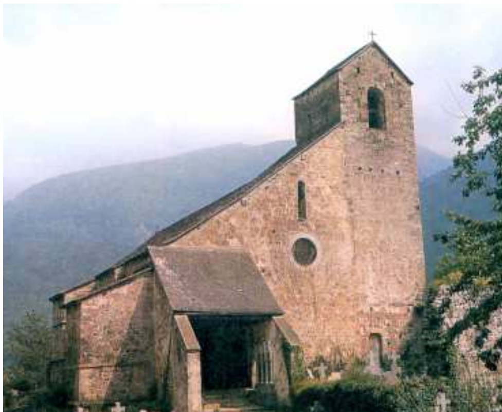
Iglesia románica de Sainte-Engrace (Zuberoa).

El grupo humano vascónico apegado al recóndito valle pirenaico del Saisson había alcanzado sin duda en el siglo VII un alto grado de cohesión interna. El fracaso de una de las operaciones armadas de limpieza dirigidas por la monarquía franco-merovingia (637) demuestra la existencia de un modelo, elemental si se quiere, pero eficiente, de organización social jerarquizada en aquel reducto conocido ya como valle o tierra de Subola , Soule. Se desconocen, por lo demás, las posteriores vicisitudes de esta pequeña comunidad montañesa hasta su reaparición a mediados del siglo XI como uno de los citados vizcondados feudales de Gascuña.