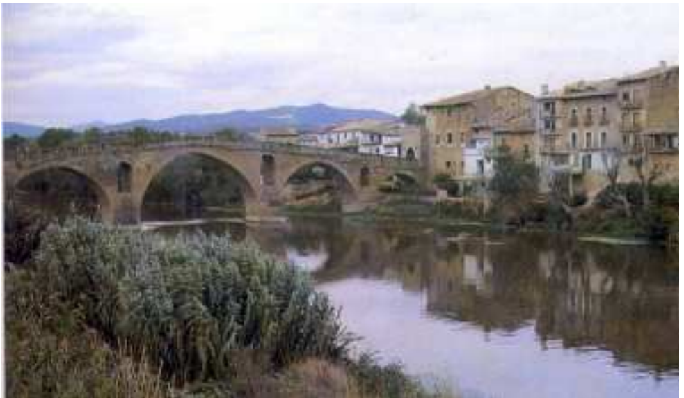
Puente la Reina (Navarra).

Aunque sin perder su antiguo rango de “ciudad” por excelencia, Pamplona se había convertido tiempo atrás en “villa” de señorío episcopal. La llegada del obispo Pedro de Rodez (1083) debió de atraer ya inmigrantes de la región de Toulouse, ciudad occitana a la