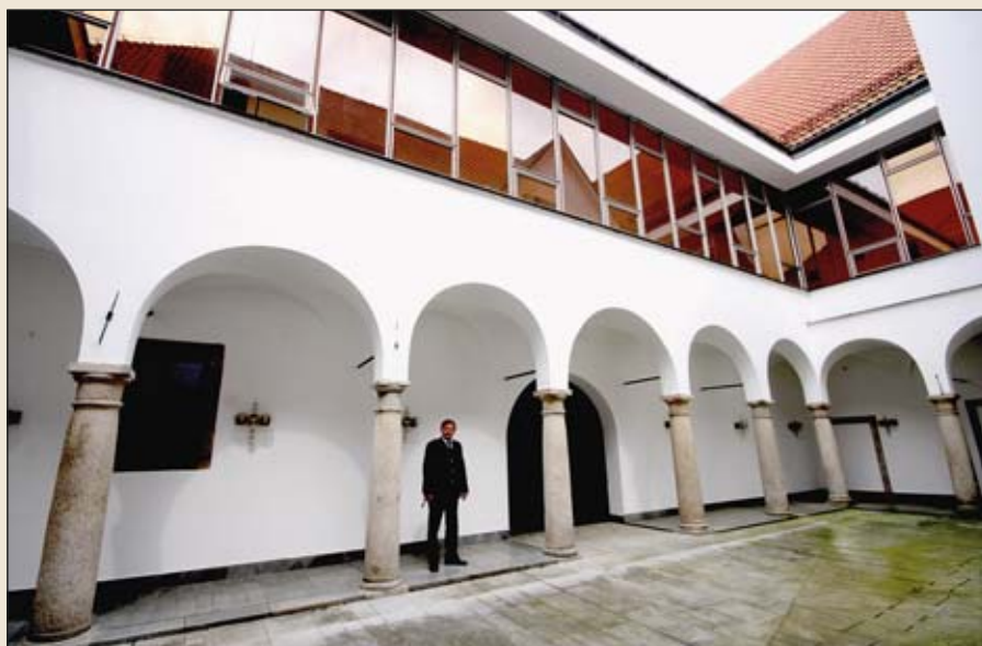
DRUHÉ NÁDVOŘÍ. Bylo rovněž citlivě rekonstruováno, žel, památkáři nepovolili jeho překrytí skleněnou střechou po vzoru obdobného nádvoří v Hranicích na Moravě. Je to škoda, mohla v tomto krytém prostoru stát muzejní hasičská technika.

rozhodnutí prodat pole od dvora: „Já, Zachariáš z Hradce na Telči a v Polné, nejvyšší komorník markrabství moravského, vyznávám tímto listem obecně přede všemi, kdož jej uzří, neb čtoucí slyšeti bude, že dobrým rozmyslem na poníženou prosbu purkmistra, konšelův a obce městečka mého Přibyslavi, poddaných mých věrných prodal jsem a pomocí tohoto listu prodávám...“