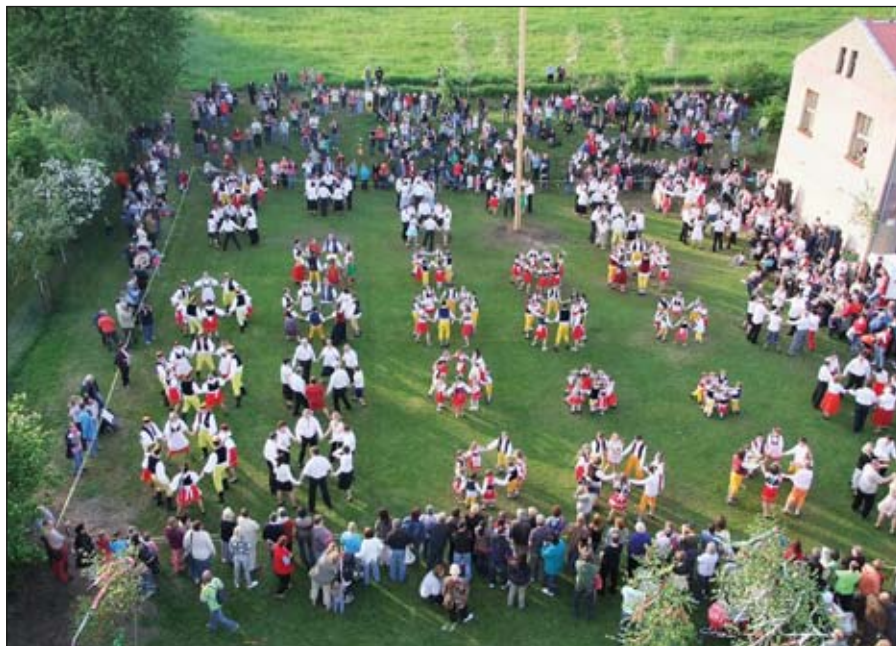
Staročeská beseda je figurový tanec pro minimálně osm tanečnicků (čtyři holky, čtyři kluci), maximum není dáno, ale musí být dělitelné osmi.

Tančilo se proto nadvakrát. Někteří účastníci přijeli třeba až z východních Čech.