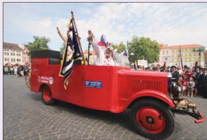
Z LÁN DO LITOMĚŘIC. V čele propagační jízdy jel automobilní žebřík Škoda 125 z roku 1927 z SDH Břežnice a doprovázela ho Praga RN z roku 1934 z hasičského muzea v Příbyslavi (na snímku).