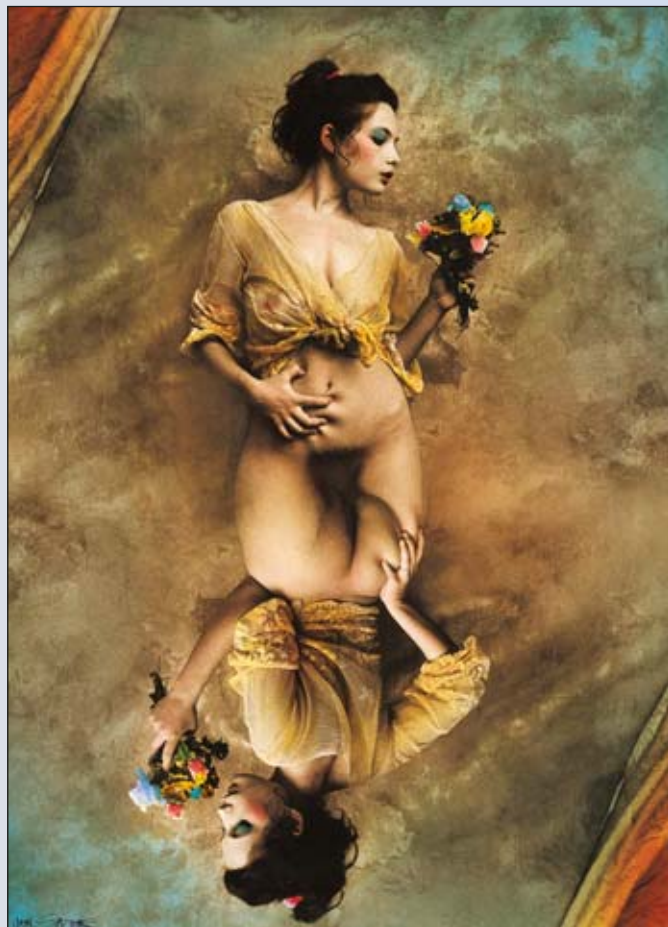
Karta 293 Teenqueen