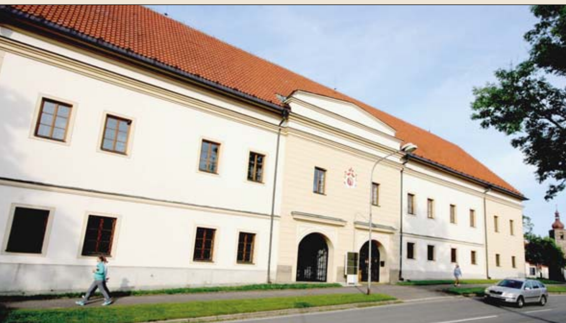
RENESSANCE. Východní průčelí přibyslavského zámku, které pochází z roku 1845, bylo nedávno omítnuto.