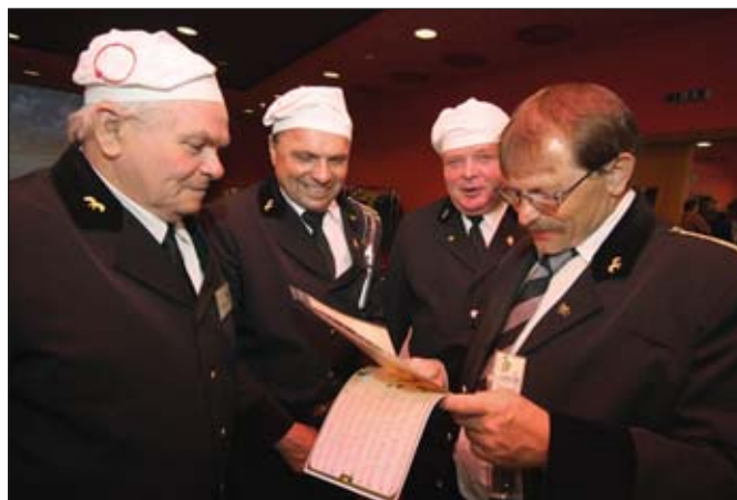
Valná hromada kominíků, blízkých přátel hasičů, se již potřetí konala pod pivovarským komínem v Táboře, v hotelu Dvořák. Na snímku si kominíci prohlížejí historický výuční list.

Spokojeni jsou kominíci se získáním autorizace k provádění zkoušek pro dílčí kvalifikace v oboru kominík od Hospodářské komory ČR. Školská komise zpracovala pro Národní ústav odborného vzdělávání kvalifikační a hodnotící standardy v oboru kominík a osnovy byly v podstatě bez připomínek přijaty. Zkoušky se již připravují a probíhají první ověřovací běh.