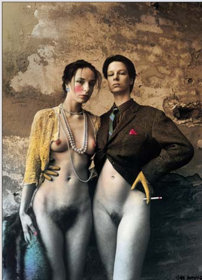
Ach ty prekrasne sestry F

Koloruje se totiž hnědá, nikoli černá, to by bylo špinavý, ty barvy. A pak jsem lidem, co za mnou chodili do toho sklepa ukazoval ty fotografie a říkal, co byste si vybrali. Všichni, protože to byli takoví primitivové jako já, si vybrali tu kolorovanou. Tak jsem to nějakou dobu začal dělat až mě to přestalo bavit, protože ono je to dosti pracné a začal jsem věřit na čistou fotografii, černobílou jako grafiku. Ale je pravda, že u té kolorované fotografie můžete umocnit některé vaše názory, které tam běžně nejsou.