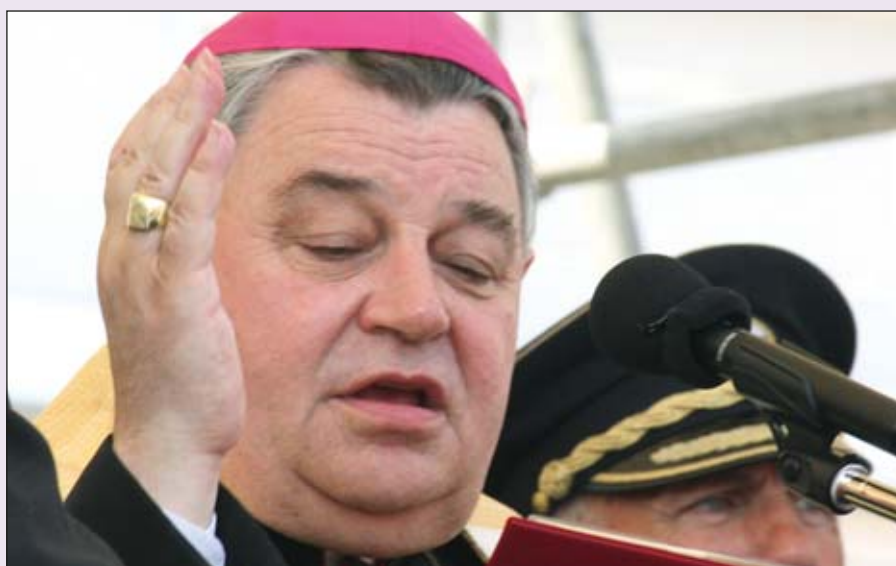
POŽEHNÁNÍ. Slavnostem v Litoměřicích požehnal primas český a arcibiskup pražský Dominik Duka. Řekl přitom, že jeho otec a dědeček byli dobrovolnými hasiči ve Varnsdorfu.