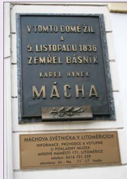
Pamětní deska českého básníka Karla Hynka Máchy, který zemřel v Litoměřicích v noci z 5. na 6. listopadu 1836.