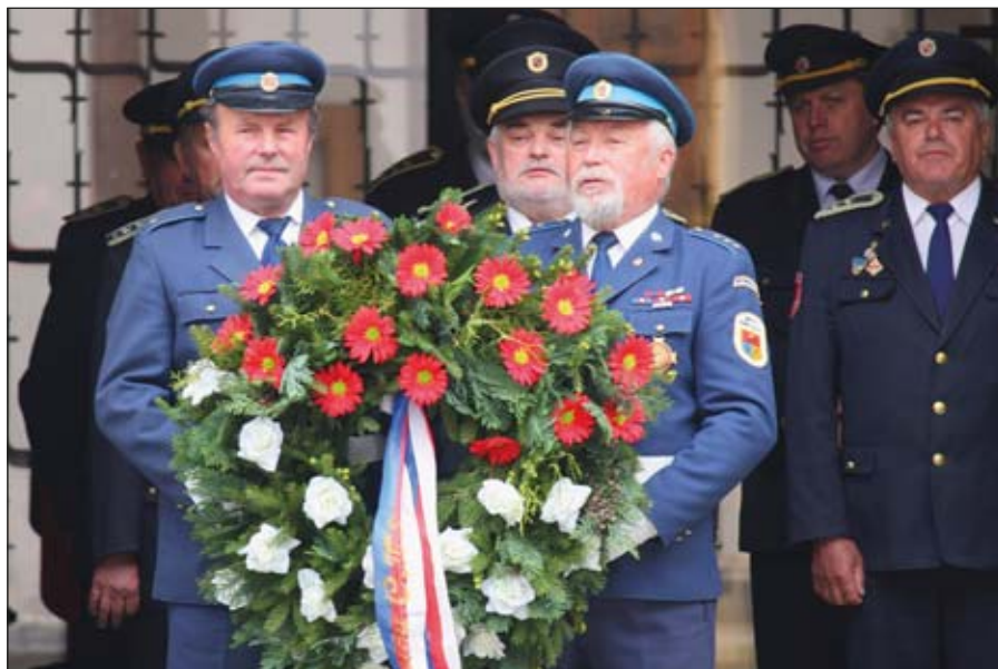
PIETNÍ AKT. Na nádvoří zámku v Příbyslavi byla 8. května uctěna památka hasičů, kteří padli ve 2. sv. válce.

Dobrovolní hasiči bojovali u Sokolova, v Dukelském průsmyku, u Liptovského Mikuláše, v Ostravské operaci, ale také v polské armádě a v československých vojenských útvech ve Velké Británii. Na frontách zahynulo nejméně 3 115 hasičů. Uvádí to publikace Českého svazu bojovníků za svobodu. Když k nim připočteme tisíce hasičů, kteří se stali obětmi domácího odboje, dojdeme k závěru, že to nejcennější – život – v boji s hitlerovským Německem položily přes čtyři tisíce českých, moravských a slezských hasičů.