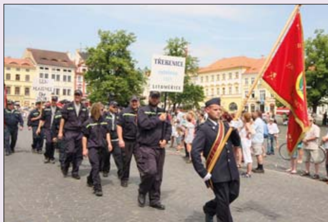
MÁCHOVI DĚDICI. Sbory z Litoměřic a z blízkých Třebenic a Velkých Žernosek (na vedlejší straně) pochodovaly v průvodu na hasičských slavnostech v Litoměřicích.