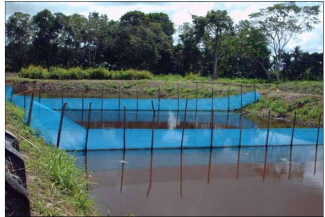
Figura 2. Lagunas donde se realizaron los ensayos de cultivo del coporo.

(Díaz y López, 1993), no se consideran letales para el coporo, ya que estos niveles no fueron sostenidos por tiempos prolongados.