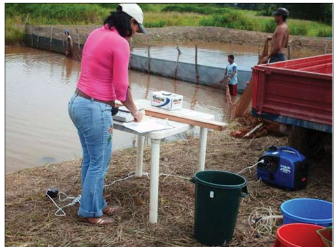
Figura 3. Investigadora realizando muestreo de peso y talla del coporo en finca de productor.