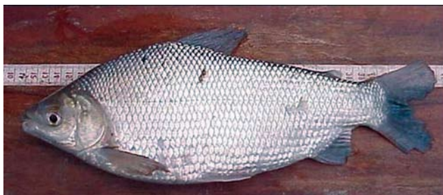
Figura 1. Ejemplar de coporo adulto.

E l coporo ( Prochilodus mariae ) es uno de los peces de agua dulce, de mayor importancia comercial en las pesquerías venezolanas, pertenece a la familia Caracidae y se caracteriza por poseer un cuerpo alargado y comprimido, con coloración oscura en el dorso y plateada en la región ventral (Figura 1). Esta especie forma parte fundamental de la dieta de las poblaciones asentadas en las riberas de los ríos, donde se pesca durante todo el año. Sin embargo, se ha observado una leve, pero sostenida, disminución de su presencia en las capturas, reportada por Novoa (2002), para el eje fluvial Orinoco – Apure, posiblemente, debido a la gran presión de pesca de la que es objeto, y a las alteraciones en el curso de los ríos que podrían interferir con el comportamiento migratorio de esta especie, afectando su ciclo reproductivo. En tal sentido, con el objeto de contribuir al aseguramiento de la disponibilidad de este rubro alimenticio para la población venezolana, se han realizado experiencias de cría en lagunas de tierra, aprovechando la potencialidad de cultivo que posee la especie con lo que se podría ofrecer una alternativa a la producción dulce acuícola en el país, que hasta ahora es dominada principalmente por el cachamote o híbrido de cachama por morocoto.