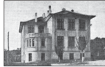
Земеделското училище, 20-те години на XX век

От „Кратки исторически бележки за град Провадия“ (1893 г.) става ясно, че през 1888 г., 10 години след Освобождението, в Провадия има три български училища – третокласно с четирима учители и 120 ученици,