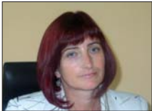
техните представители в местния орган на самоуправление.

В ОБС-Провадия има представители на шест политически сили, но моето убеждение е, че в Съвета не трябва да има политика, а всички заедно да работят за положително развитие на общината. ОБС трябва да бъде екип, а общинските съветници и гражданите – да бъдат достатъчно информирани за всичко. Стремя се да създавам делова, спокойна и ефективна атмосфера за работа.