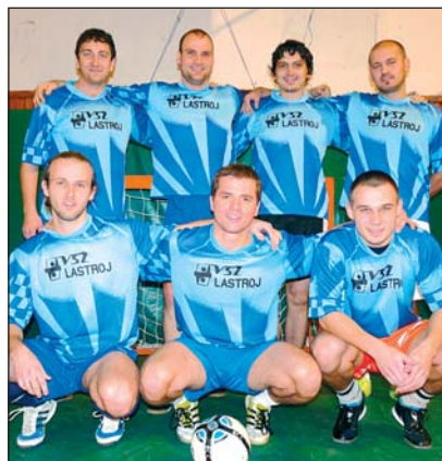
SIMPSONI neobhájili minuloročné prvenstvo a skončili na 2. mieste.

Traja striedajúci sa rozhodcovia J. Mađeja, J. Gnip a E. Barát dohliadali na dodržiavanie pravidiel. Atmosféru a športový zážitok dotváralo množstvo divákov podporujúcich svojich favoritov.