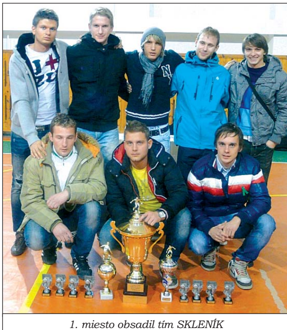
1. miesto obsadil tím SKLENÍK

Jednotlivé zápasy „štyria na štyroch“ sa hrali 2x7 minút a hralo sa systémom „každý s každým“. Nasledne boli družstvá rozdelené do dvoch skupín na základe priebežných výsledkov. Prítom sa započítavali body zo zápasov odohraných od začiatku až do konca turnaja.