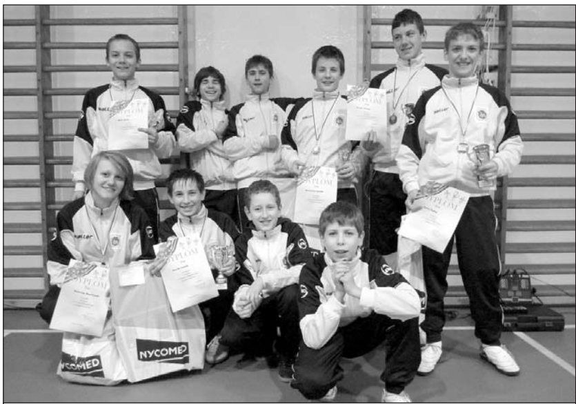
Žiaci Klubu šermu Snina boli úspešní na turnaji v Krosne