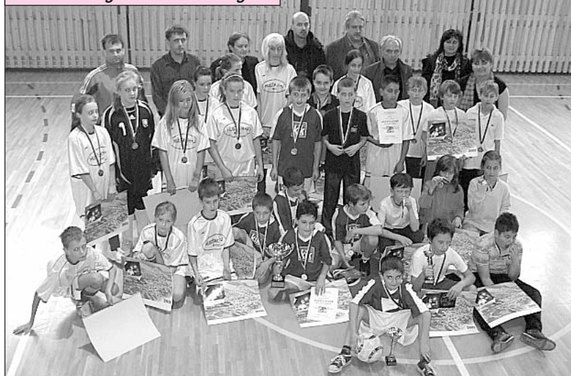
Účastníci turnaja o pohár starostky obce Ohradzany