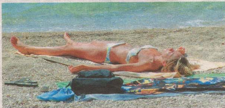
Prvić je otok na kojem će se posjetitelj zbilja odmoriti

vjetar, more i cvrčci. Tu i tamo prode poneki motokultivator, osnovno prijevozno sredstvo na otoku. Automobila nema, ali ima mnogo šljunčanih plaža, pa se ovdje odmara mnogo obitelji s malom djecom. I mnogo onih koji se vole kupati bez odjeće. Obala između naselja prepuna je skrovitih mjesta s velikim ravnim stijenama, idealnim za sunčanje, pa se povratnice s Prvića ne moraju brinuti o bijelim crticama na ledima.