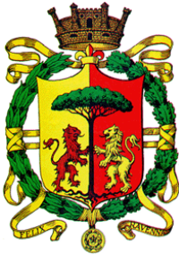
Comune di Ravenna