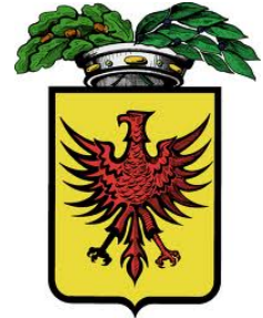
Provincia di Ravenna