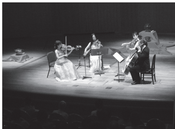
図8 音楽ホールでの弦楽コンサート。 スズムシの入った壺をホール内に配置した。