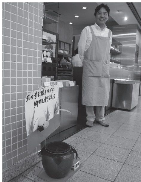
図6 スズムシが入った壺を置いた商店

「鳴く虫と郷町」のメイン会場は、中心市街地内にある伊丹郷町館の旧岡田家酒蔵（重要文化財）と旧石橋