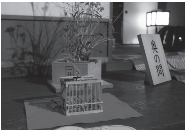
図4 伊丹郷町館内の鳴く虫展示