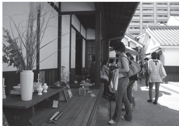
図5 来場者で賑わう伊丹郷町館 左は伊丹市立博物館による伊丹のお月見展示

「鳴く虫と郷町」でおこなった展示やイベントの多くは、基本的に各々がすでに行ってきた事業をアレンジしたり、組み合わせたものだ。組み合わせただけでも、複合的な分野にまたがるイベントはこれまでにはない魅力を放ち、新たな利用者層の興味関心を引きだすイベントになる。それぞれの専門家が担当するので、突っ込んだ内容にも対応できる。この方法は、開発の労力や費用を最低限に抑えることもできる。イベントはそれぞれの博物館や団体が企画し、自ら実施する。全く新たなイベントもあるが、特に全体のテーマから逸脱しない限り、歓迎する考えだ。そうした中で期間中に開催した展示やイベントは、併せて30ほどとなった。