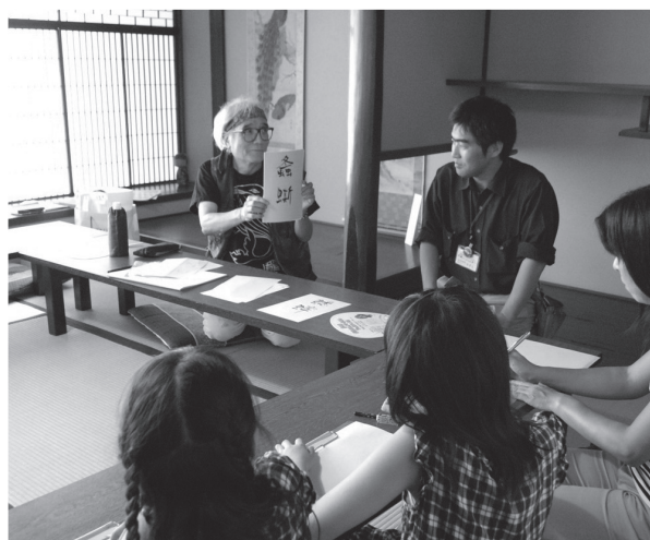
図9 「鳴く虫おやこ句会」のようす