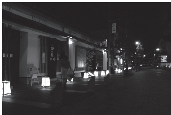
図7 行灯でライトアップされた商店街

関連イベントの内容も昆虫だけでなく、音楽、俳句、植物、天文など連携各団体の事業を、鳴く虫や初秋にちなんだ内容にアレンジして実施した。会場はメイン会場の伊丹郷町館だけでなく、実施者の都合で他の場所でも行われた。たとえば「鳴く虫プラネタリウム」は伊丹市立