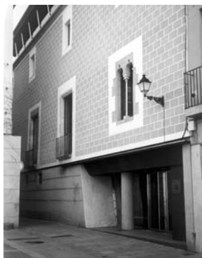
Arxiu Històric Comarcal de Mataró

L'Arxiu Històric Comarcal de Mataró és situat a Can Palauet, un immoble dels segles XV-XIX, adquirit per l'Ajuntament de Mataró l'any 1983, que pertanyia a la família Palau. L'arxiu comparteix l'edifici amb una sala d'exposicions municipal. La superfície és de 1.015 m 2 i disposa dels següents equipaments: una àmplia sala de consulta en la zona noble de l'edifici amb 24 punts de treball, amb una biblioteca auxiliar a l'abast dels investigadors, sala de conferències i reunions, sales de tractament de documentació i sala de recepció i desinsectació, i sala climatitzada per a suports fotogràfics. Els dipòsits tenen una capacitat de 4.000 metres lineals, així com mobles per a la instal·lació de documents en formats especials. L'aportació econòmica del Departament de Cultura ha estat de cent milions de pessetes. El projecte ha estat elaborat pels arquitectes Isidre Melsosa i Montserrat Torres. La directora és la senyora Rosa Almuzara i Roca, l'adreça: Can Palauet, carrer d'en Palau, 32, 08301 Mataró (Maresme), telèfon i fax: 93 758 24 59.