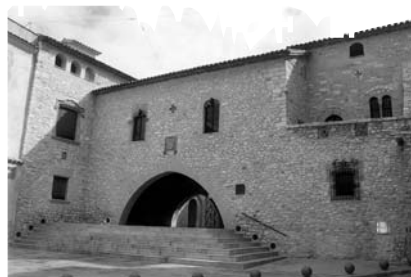
Arxiu Històric Comarcal de Vilanova i la Geltrú