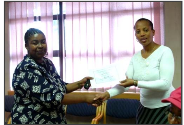
Participant d'un district au Lesotho reçoit un certificat À la fin d'un atelier de Lesotho DevInfo

Une équipe de 2 formateurs est consacré à animer des ateliers de sensibilisation et de formation sur la base de données Lesotho DevInfo. Les ateliers de formation ciblent les équipes de planification des districts et des autres partenaires stratégiques aux districts. Ils ont pour objectif de former des personnes qui sont clé dans la mise en œuvre de toutes les initiatives de développement du Gouvernement. Jusqu'aujourd'hui l'équipe de suivi et d'évaluation a organisé des formations dans trois des dix districts du pays.