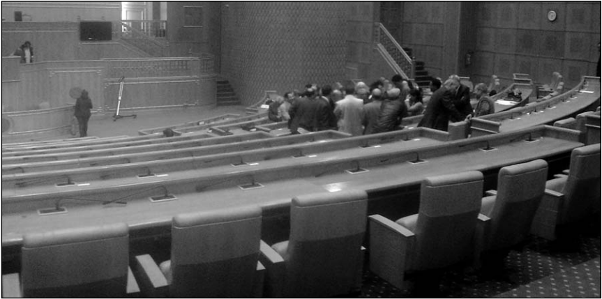
جانب من جلسة الهيئة