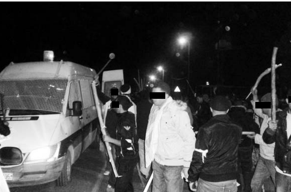
عدد من أبناء الوردانيين أثناء حجز إحدى سيارات الدورية الأمنية ليلة الحادثة