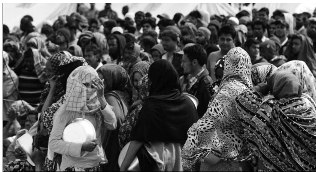
تصانم تلقائي مع العائلات الليبية الوافدة على الجنوب التونسي هربا من الحرب

وفي هذا السياق وصلت أمس إلى مدنين شاحنة قادمة من ميناء رادس على متنها 10 آلاف وحدة تتضمن كل واحدة منها مجموعة