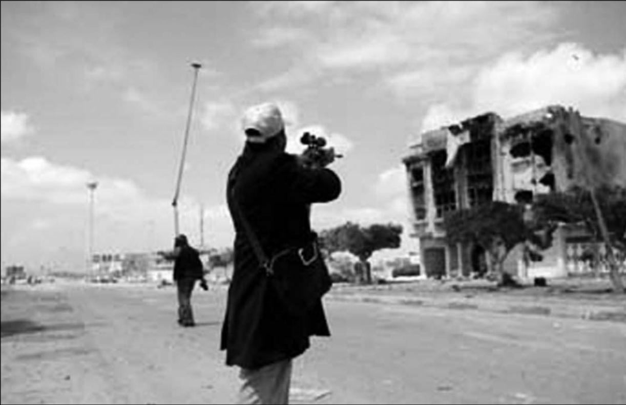
الثوار أحبطوا هجمات كتائب القذافي رغم الفارق الكبير في التسلح

سيف الإسلام القذافي إن الحكومة ستهزم المعارضة المسلحة التي تحاول الإطاحة بوالده وأن دستوراً جديداً للبلاد جاهز لاعتماده بعد هزيمتها. وقال سيف الإسلام الذي كان يتحدث في التلفزيون الليبي الرسمي " اتهم المجلس الوطني الانتقالي المعارض بأن ما يحركه هو مطامع السلطة والثروة النفطية ". ونسب إليه قوله إن الوضع الميداني يتغير لصالح النظام وأن والده سيغلب على الثوار.