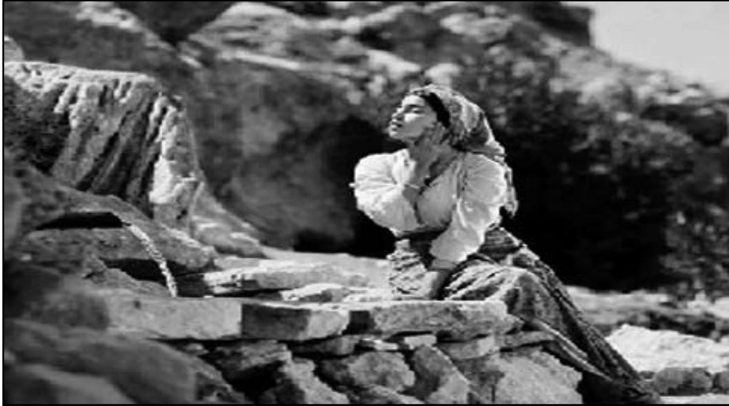
مشهد من فيلم «منبع النساء» المغربي

– قياسا بما هو قائم في غيره من المجتمعات العربية... – أوردنا هذا الاستطراد المطول – نسبيا – حول هذه «النوعية» من الأفلام العربية لتتساءل ما إذا كان الإعلان عن ادراج المرأة في المجتمع المغربي...؟