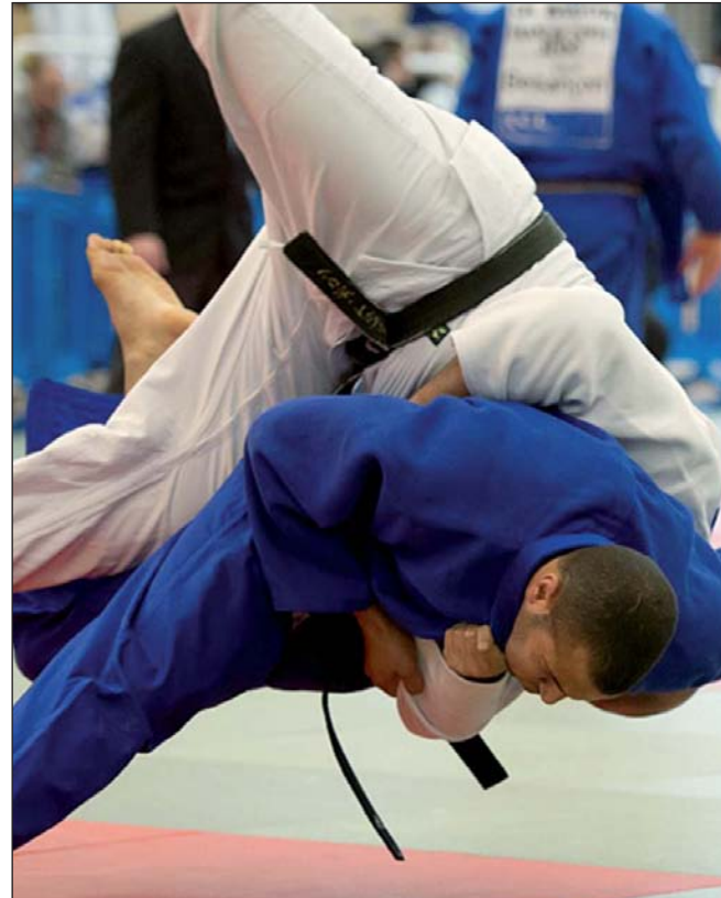
أنيس بن خالد في دورة سويسرا المفتوحة الشهر الماضي

اوردت العديد من الصحف الفرنسية والسينغالية خبر إيقاف بطل الجيدو التونسي والحامل أيضا للجنسية الفرنسية أنيس بن خالد يوم الاحد الفارط بمطار دكار حين كان يهم بالعودة الى تونس بعد مشاركته مع المنتخب الوطني للجيدو في البطولة الافريقية 32 بدكار والتي تحصل خلالها بن خالد على الميدالية الفضية لوزن اقل من 100 كغ . وحسب صحيفة «فرانس - سوار» فان انيس بن خالد مطلوب في فرنسا في قضية متاجرة بالمخدرات وهو فار هناك من العدالة وحين تم الاعلان عن مشاركته في البطولة الافريقية للجيدو تحول فريق من الشرطة الفرنسية الى دكار اين تم القاء القبض على انيس بن خالد بالتعاون مع الشرطة السينغالية.