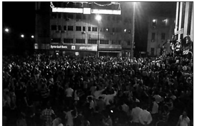
متظاهرون في مدينة حمص السورية

دمشق (وكالات) قالت مصادر سورية أنه جرى أمس، عزل مسؤول أممي كبير في مدينة بانياس الساحلية التي تجددت فيها الاحتجاجات على غرار مدن أخرى من البلاد رغم إعلان السلطات عن سلسلة قرارات يقضي أحدها برفع حالة الطوارئ السارية في البلاد منذ عام 1963، فيما قال حقوقيون أن قوات الأمن قتلت 3 متظاهرين في مدينة حمص وأعتقلت أحد المعارضين هناك. وأفاد المرصد السوري لحقوق الإنسان نقلاً عن مصادر في العاصمة دمشق بأنه جرى عزل رئيس قسم الأمن السياسي في مدينة بانياس السورية.