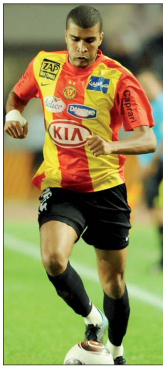
محمد علي بن منصور