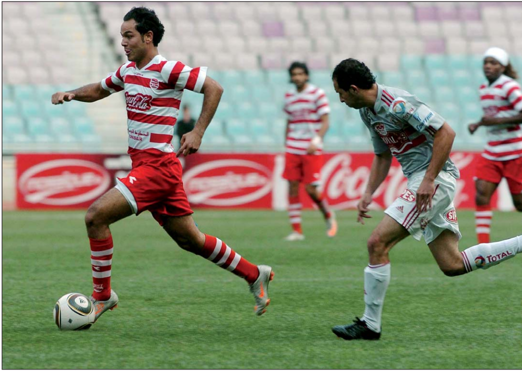
موعد متجدد للأفريقي في رابطة الأبطال