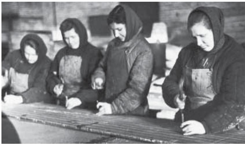
Бригада разметчиц завода