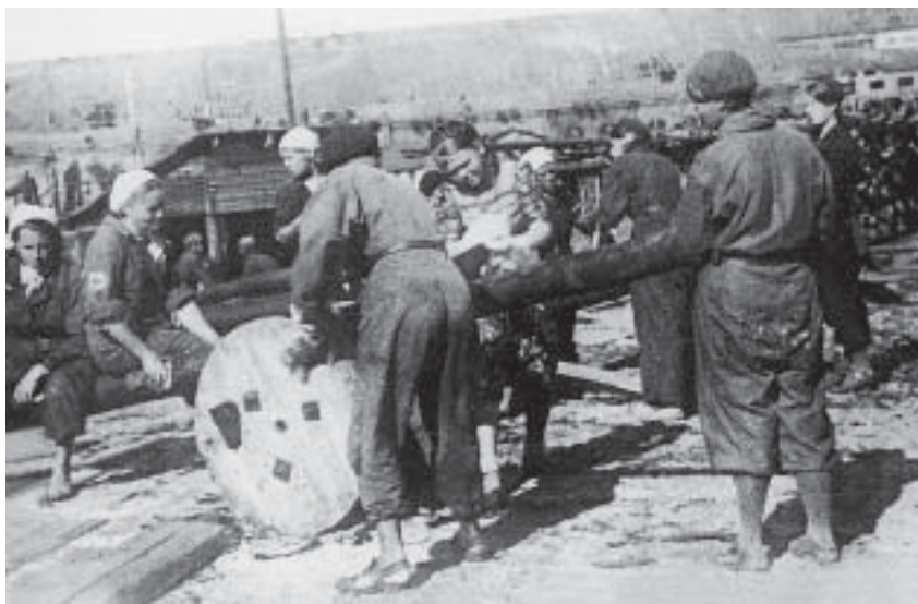
Заготовка дров во время войны