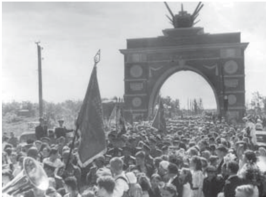
Встреча воинов у Арки победы в Автове. 1945 г.

Роль Кировского района Ленинграда в защите города огромна. Многие аспекты этой страницы нашей героической истории еще нуждаются в дополнительном изучении и осмыслении. ■