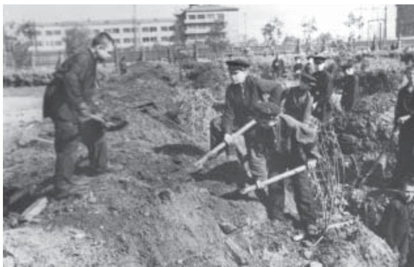
Ремесленники строят баррикады у ДК Газа. 1941 г.