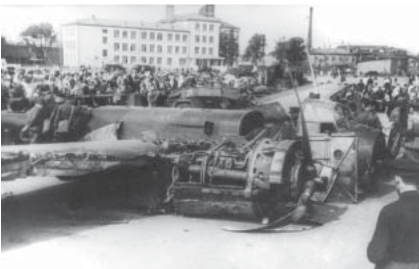
Выставка трофейной техники на Кировской площади.