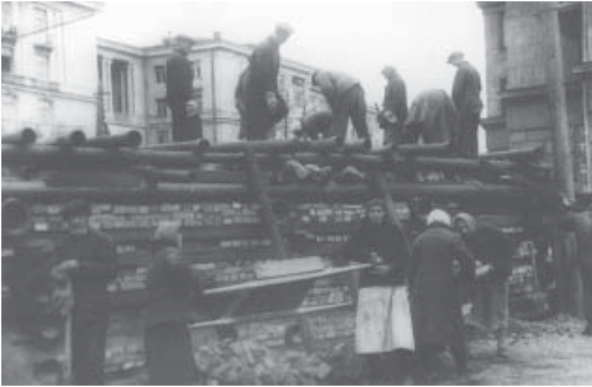
Баррикада на улице Стачек. 1941 г.