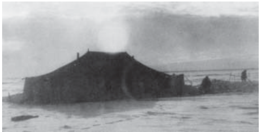
Медицинская палатка на 7-м км ледовой трассы