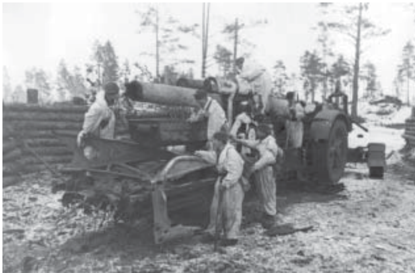
Бойцы демонтируют пушку «Берта» на Вороньей горе. 1944 г.

Армия врывается в город на плечах отступающего противника, не успевающего организовать оборону. Так было с большинством городов на Западном фронте. Дивизии народного ополчения Ленин-