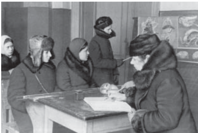
Занятия в школе зимой 1941–1942 гг.