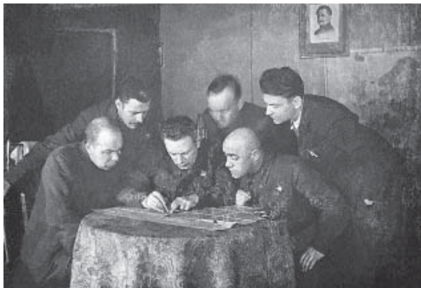
Разработка плана уничтожения завода. 1941 г.

На второй день войны на завод пришел пассажирский теплоход «Андрей Жданов» – его требовалось срочно переоборудовать под госпитальное судно. Это была первая большая работа, выполнявшаяся для начавшей войну армии. Пятьсот рабочих трудились на судне, и через три недели оно было готово для приема раненых. Одновременно форсировались работы на кораблях с высокой степенью готовности. К 9 июля удалось завершить государственные испытания эсминца «Статный», 18 июля вступил в строй «Скорый». К 30 августа удалось подготовить к боевым действиям недостроенные «Строгий» и «Стройный». Эти корабли были условно приняты в состав ВМФ, подняли военно-