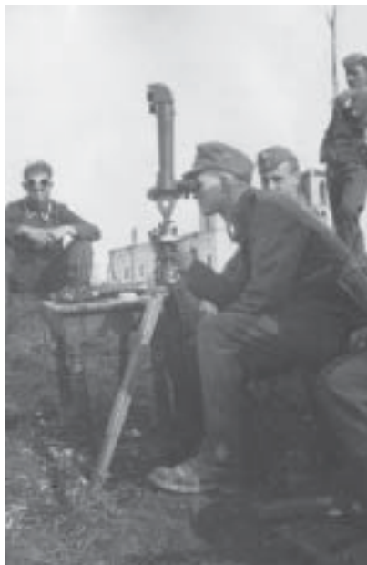
Немецкие артиллеристы на горе Кирхгоф.

ковой дивизией лежал Кировский район, 6-я Мюнстерская танковая дивизия прикрывала Пулковское направление, 8-я Берлинская танковая дивизия была брошена на Волховский фронт. Использование танковых сил в штурме такого города, как Ленинград, было бы безумием, и Гитлер своим звериным чутьем понимал это. Он верил теоретику танковой войны Гудериану. «Танки мало пригодны к ведению боя в населенных пунктах и совершенно не-