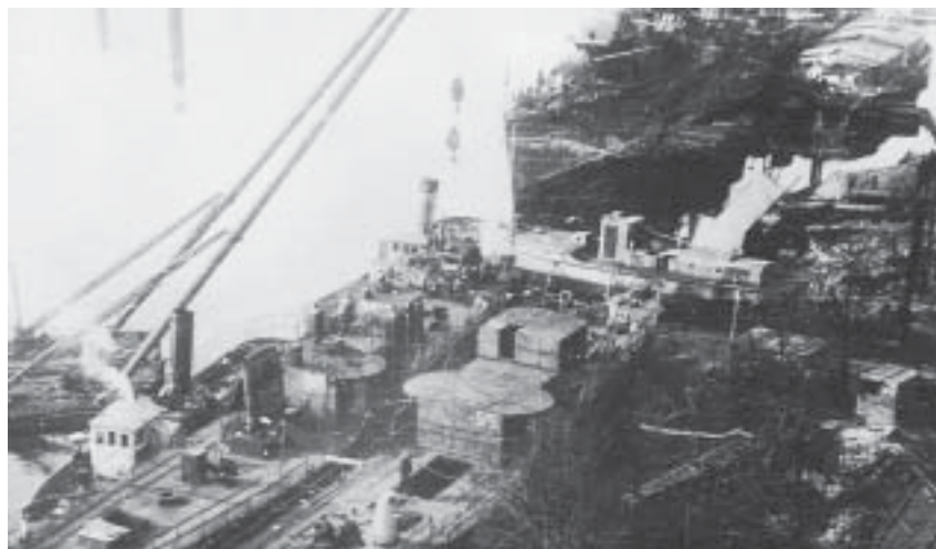
Строительство тральщиков. 1943 г.