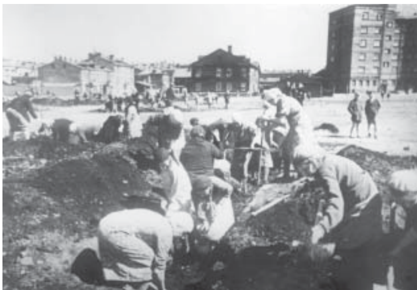
Рытье окопов на Кировской площади. 1941 г.