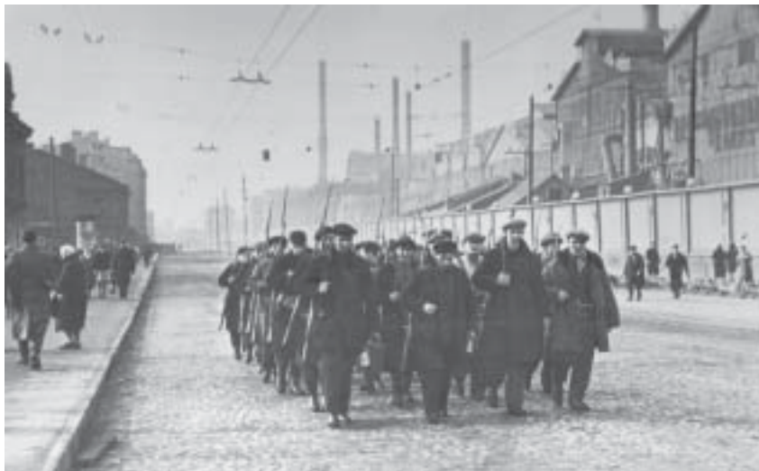
Рабочие-ополченцы. Фото 1941 г.

С момента моего расставания с Ленинградом прошло больше трех месяцев. И вот, взяв с собой дневную пайку сухарей и бутылоч-