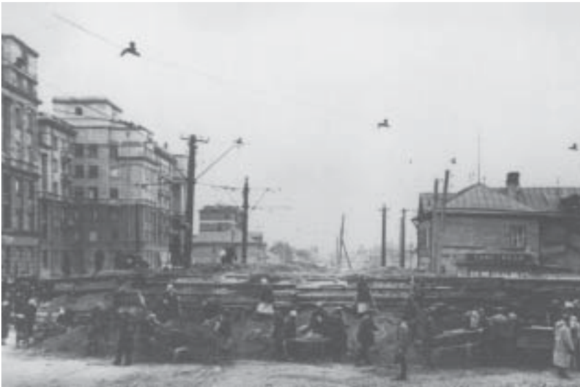
Сооружение баррикады в Автове. 1941 г.