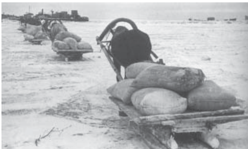
Обоз с продовольствием

минуту могли провалиться, но – переехали! Мы уже не в блокаде!