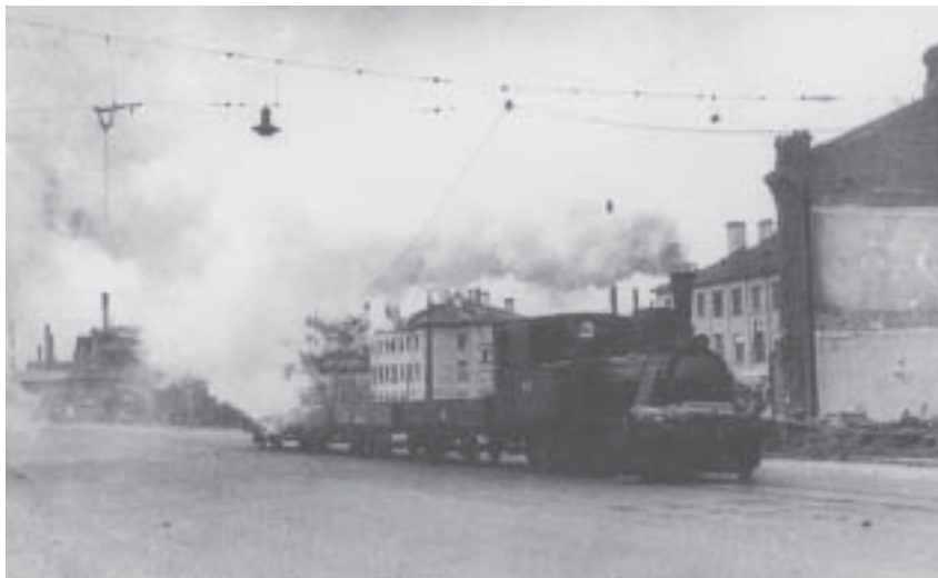
Улица Стачек. 1941 г.

Сталин переоценил аналитические способности Гитлера, и вот гитлеровцы стояли у ворот Ленинграда, а как свидетельство колебаний фюрера – бывший немецкий крейсер «Лютцов» посылал снаряды на головы немецких солдат.