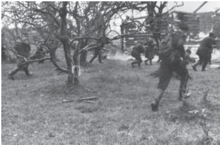
Бои в районе Лигова. 1941 г.

Эти сто десять дней и ночей, проведенные в труднейших условиях суровой зимы 1941 года, запомнились мне как тяжелейшие за всю войну. Снабжение боеприпасами было более чем скромным (2 снаряда в сутки на ствол), блокадное питание 300 грамм сухарей и ложка чечевицы на дне похлебки в сутки, и это при непрерывном обстреле наших позиций и днем, и ночью. Мы несли большие потери. Поэтому мне пришлось за этот относительно небольшой срок сменить несколько подразделений. После уничтожения нашей батареи вражеским огнем я командовал взводом разведки, взводом управления минометного батальона, а затем и ротой. Довелось участвовать в отражении десятка атак противника и в нескольких, увы, тогда безуспешных, наших контрата-