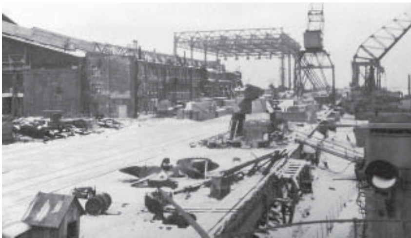
Заводская набережная. 1944 г.

Однако и враг вел по заводу прицельный огонь по эллингу, по движущейся стреле портального крана, по дыму заводского паровоза, по вспышкам электросварки. Мужественное поведение наших рабочих под обстрелом вызывало восхищение. С грохотом разрывался снаряд в цехе, падал человек. Подбегали сандружинницы. Чуть покосившись в сторону разрыва, соседи продолжали работать у станков. Дирекция и партком запретили работать во время артиллерийских обстрелов, приказав прятаться в щели и блиндажи. При первых же ответных выстрелах наших батарей все занимали свои рабочие места. В некоторые дни количество обстрелов доходило до шести!