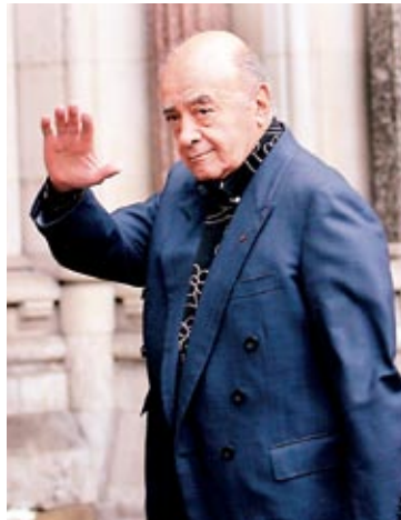
MOHAMED AL FAYED , el predecesor de todos los hombres del mundo árabe, compró el Fulham en 1997.

Antes de España, los multimillonarios pioneros incursionaron en el fútbol se entraron en Inglaterra, donde alrededor de