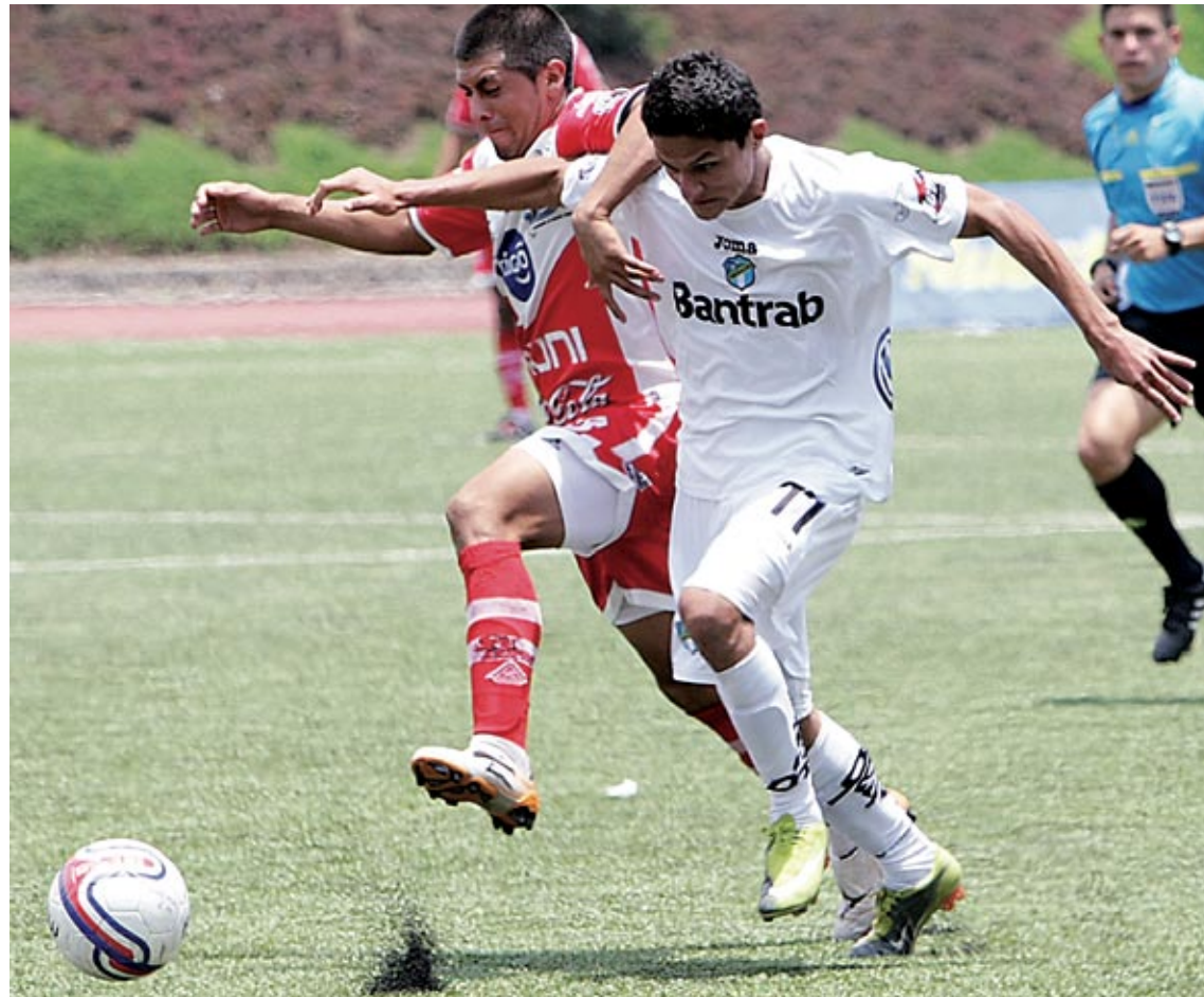
COMUNICACIONES y Malacateco disputaron el tercer lugar de forma directa. Los cremas ganaron el duelo.