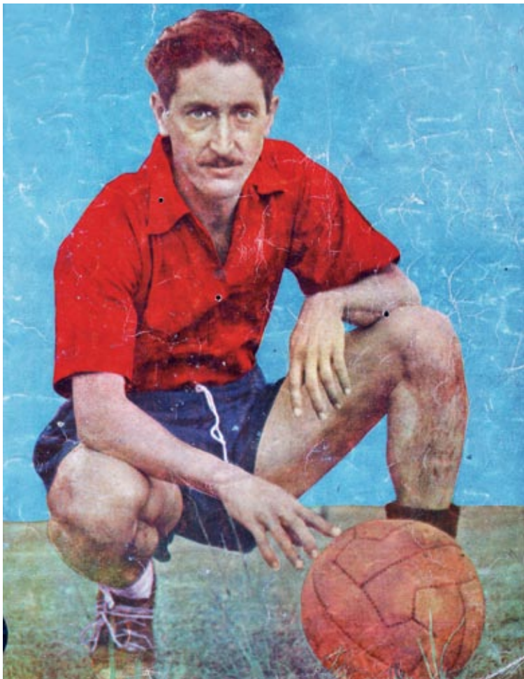
CARLOS PEPINO TOLEDO , en su pleno apogeo como estrella de Municipal y de la selección nacional en 1948.