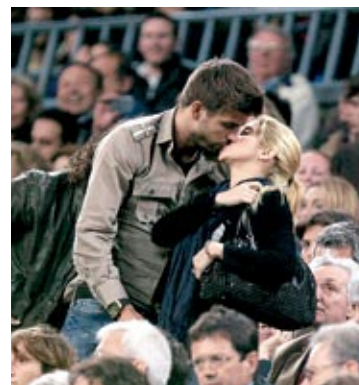
EL DEFENSA Gerard Piqué se besa con su novia, la cantante colombiana Shakira, durante el partido entre el Barcelona y el Osasuna.

El técnico del Barça parece cansado de aguantar los emba-