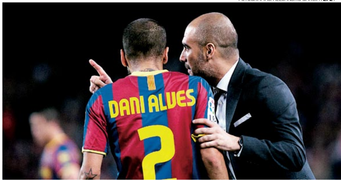
EL ENTRENADOR del FC Barcelona, Josep Guardiola (d), da instrucciones al defensa brasileño Daniel Alves durante el partido que el conjunto azulgrana le ganó 2-0 al Osasuna.

“Si es así, estoy convencido de que el entrenador del Real Madrid estará felicísimo, estará contentísimo. Si al final es así, lo fue mucho el año pasado en la ida y lo será esta vez”, dijo Guardiola, que de paso recordó el arbitraje sufrido la temporada pasada por el Barça en la ida de las semifinales de la Champions