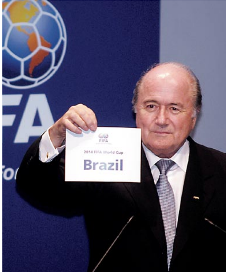
EL PRESIDENTE de FIFA, Joseph Blatter, cuando dio a conocer que Brasil sería la sede del mundial 2014.