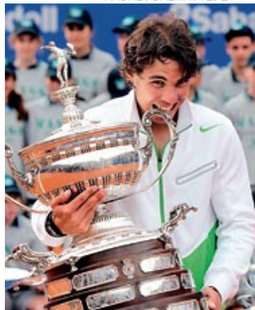
EL TENISTA español Rafael Nadal mordió el trofeo que lo acreditó como vencedor del torneo Conde de Godó tras vencer a David Ferrer.