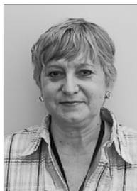
Председатель 2007–2010 гг.