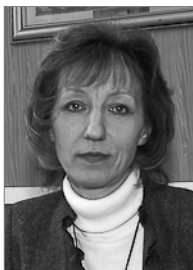
Руководитель 2007–2010 гг.