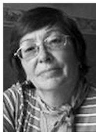
Председатель 2006–2009 гг.