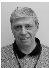
Председатель 2008–2011 гг.