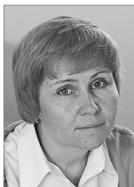
Председатель 2008–2011 гг.