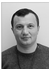
Руководитель 2007–2010 гг.