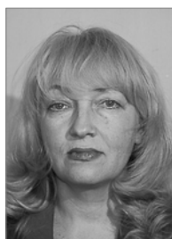
Председатель 2009–2012 гг.