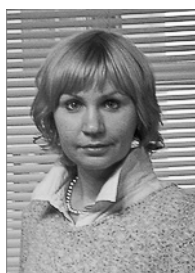
Руководитель 2009–2012 гг.