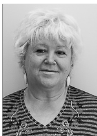
Председатель 2007–2010 гг.