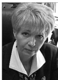
Член комиссии 2007–2010 гг.

Руководитель Центра методической работы и сетевого взаимодействия Центральной городской публичной библиотеки им. В.В. Маяковского д. 46, наб. реки Фонтанки, Санкт-Петербург, 191025 Тел.: (812) 571 27 53; Факс: (812) 571 22 47 E-mail: nmo@pl.spb.ru