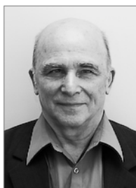
Руководитель 2008–2011 гг.