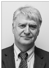
Председатель 2008–2011 гг.