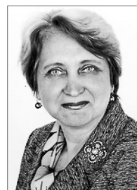
Председатель 2009–2012 гг.

Старший преподаватель Московского института открытого образования д. 6, Авиационный пер. , г. Москва, 125167 Тел.: (495) 151 69 92 E-mail: olwik2004@mail.ru