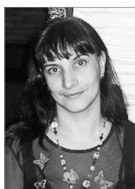
Председатель 2007–2010 гг.