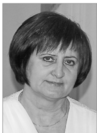
Председатель 2009–2012 гг.