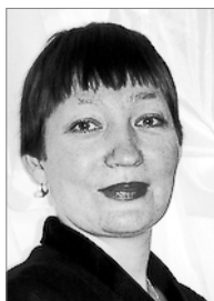
Руководитель 2009–2012 гг.