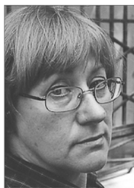
Председатель 2008–2011 гг.