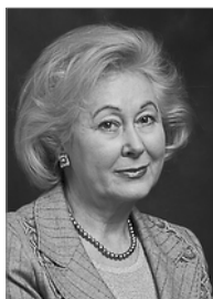
Председатель 2008–2011 гг.