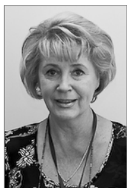
Председатель 2007–2010 гг.