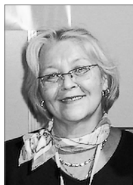
Член комиссии 2007–2010 гг.

Член Петербургского библиотечного общества, директор Централизованной библиотечной системы Красногвардейского района Санкт-Петербурга д. 8, Среднеохтинский проспект, Санкт-Петербург, 195027 Тел.: (812) 222 95 66; Факс: (812) 222 33 00 E-mail: cbs@iac.spb.ru