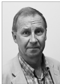
Председатель 2007–2010 гг.