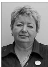
Председатель 2007–2010 гг.