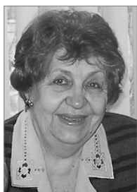
Председатель 2007–2010 гг.