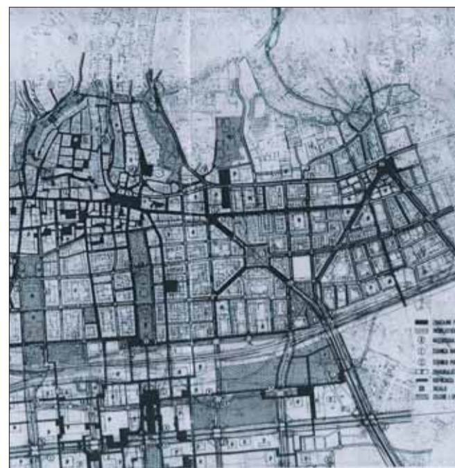
Središnji dio grada u DUP-u Centar, s rješavanjem pasažiranja