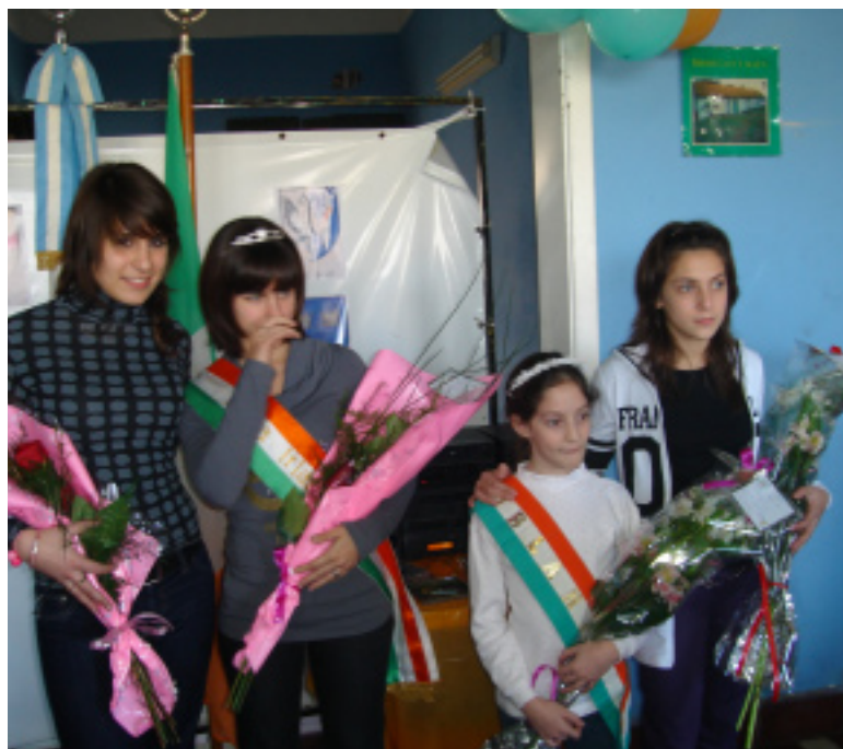
Las cuatro reinas que representarán a la colectividad en la Fiesta del Inmigrante

Durante el transcurso del almuerzo se ofrecieron comidas y postres típicos, luego se presentó el conjunto