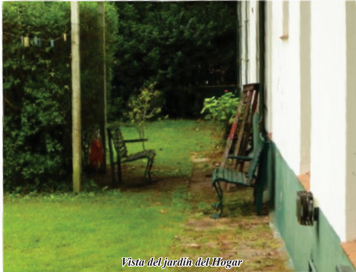
Vista del jardín del Hogar

Lo cierto es que estamos saliendo de una situación muy difícil, me refiero a una situación económica. Pero estamos saliendo, hace dos meses teníamos doce internados ahora tenemos 17. Está entrando gente al hogar por suerte aunque aun no es lo