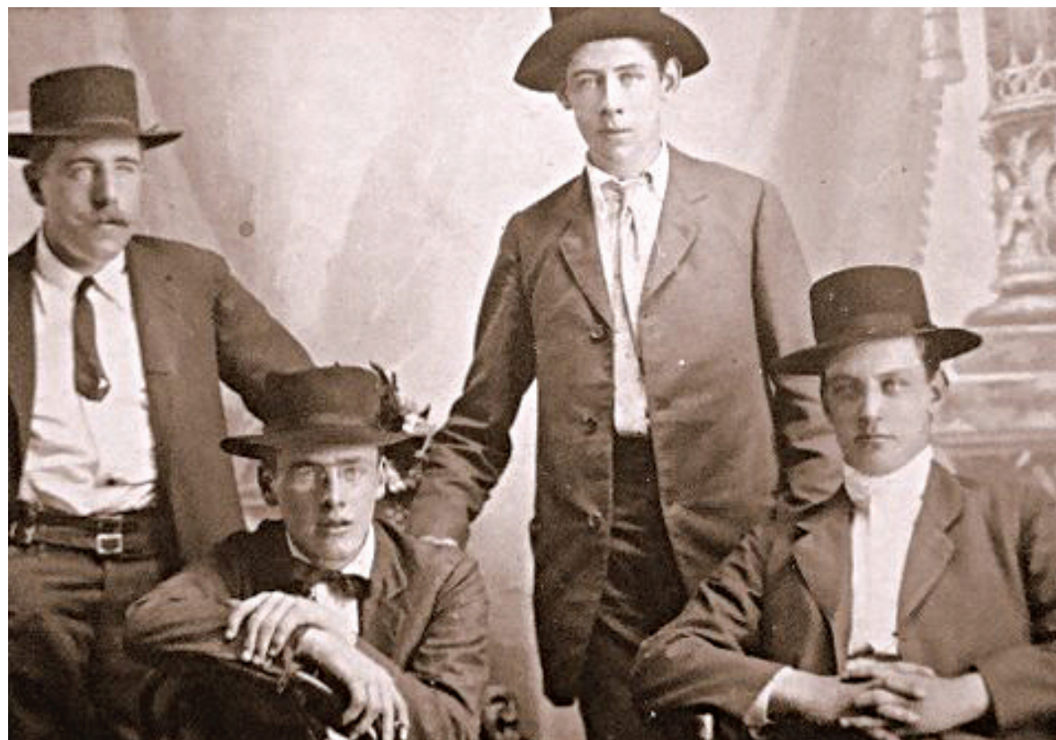
Cortesía de C. Lennon

Los abuelos de mis informantes eran personas que en su tierra natal trabajaban la tierra. Como decía uno de mis informantes, lo hacían en condiciones de pobreza, "se mataban trabajando" por una papa o un repollo. Cuando, a mediados del siglo XIX, esta situación empeoró debido a la roya (la peste de la papa) se encontraron en una situación extrema que obligó (a quienes pudieron) a dejar su tierra de origen. Para ello, viajaban primero hasta Liverpool y ahí tomaban un barco que los alejaba definitivamente del lugar. Finalmente, llegaban al nuevo destino con toda la esperanza puesta en el nuevo territorio, en la nueva vida. En las narrativas podemos ver claramente tres etapas: una que se resume en la dificultosa vida en Irlanda con el posterior alejamiento; una intermedia que se vive en el barco que los traerá a la Argentina y,