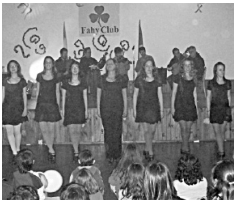
El grupo Éire en el Fahy Club

Allá por el 2003 se publicó en TSC una reseña de la fiesta organizada por el conjunto de danzas irlandesas Éire con motivo de su primer aniversario. La segunda edición no llegó a concretarse: en el día señalado, el boliche reservado para ello estaba "clausurado"; fatalidad que desalentó posteriores intentos de festejo... hasta hoy. Mucho aconteció en el medio: Éire fue tomando notoriedad, y convirtiéndose quizás el preferido para acompañar diversos grupos de música celta en sus shows. Pero sobre todo, Éire fue el conjunto elegido para representar a Irlanda en el Oktoberfest, tanto en las ediciones 2005/2007 como la del corriente año; para cuando ustedes lectores repasen estas líneas. Mientras se esperaba la confirmación del viaje a Córdoba, "las chicas" -inquietas- pidieron revancha y organizaron un nuevo evento: Éire suena Tremendo. La idea era hacer una suerte de mix entre "irish session" y "fiesta retro". Pese a que fue quizás la noche más fría del año, el pasado 6 de Septiembre el salón del Fahy Club se colmó de gente atraída por la novedad. En la caja del buffet (cual casa de valores) se cambiaban pe$os por Éires, bono creados para evitar las monedas. Abrieron los actos Brian Barthe con su gaita y Ferry O'Killian en bodhrán, desfilando por el salón. Luego, el joven Félix (hijo de Moria Kaplun y del actor Manuel Vicente) en violín/tin whistle, y un amiguito en guitarra -