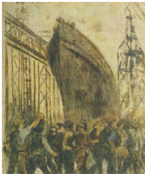
Reproducción de The Launch , de William Conor

de nuestros informantes. Una vez arriba del barco, son seres completamente desposeídos, han dejado atrás lo poco que tenían y serán, a partir de aquí, “formados de nuevo”, habrán de cambiar su situación estructural, su condición, su lugar en la jerarquía social. Una vez traspasado el portal y una vez entrados en el tercer estadio, el presente se ve con nuevas expectativas, con un probable cambio de costumbres, con la visión de un futuro a edificar bajo nuevas y prometedoras condiciones que les dan la posibilidad de tener una tierra propia para trabajarla. La Argentina que encuentran es un campo propicio para llegar a la ansiada propiedad de la tierra (1). El lugar ideal para tener sus animales, venderlos o vender sus productos; para vivir en una sociedad donde sentirse libres de practicar su religión, donde el trato recibido es diferente, mejor; donde pueden, de a poco, ganarse un espacio sin sentir el estigma de la inferioridad. Han pasado, básicamente, de trabajar la tierra y los animales de otros a tener y trabajar los propios, han dejado de ser agricultores para ser criadores de ganado ovino, cambiando junto con ello su lugar en la jerarquía social. Al descubrir las nuevas condiciones y las posibilidades de vida en Argentina, se constituye el nuevo mundo, se funda un nuevo espacio donde se puede volver a construir la vida, se da un proceso de construcción de un