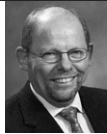
Біргер Ріс Йоргенсен Голова Датської торгової ради Державний секретар, Посол

Особливо оптимістичним фактом є відкриття декількома датськими компаніями своїх офісів в Україні, що є підтвердженням мати довгострокові плани на українському ринку. Але є ще багато можливостей для подальшої співпраці, і я сподіваюсь, наша присутність в Києві та Дніпропетровську спонукає Вас на майбутнє партнерство з датськими бізнесменами. Наші компанії відомі своїми технічними досягненнями та ноу-хау, мають багато пропозицій продукції та послуг по кожному виду діяльності.