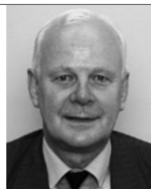
Його Високоповажність Посол Данії в Україні Пан Крістіан Фабер-Род

Кредитні програми Данії щодо українських комерційних та муніципальних установ дають можливості для конкретних результатів по контрактах. Разом із ратифікацією