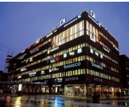
Головний офіс Конфедерації Датських промисловців

Конфедерація датських промисловців – центральна організація датської виробничої індустрії.