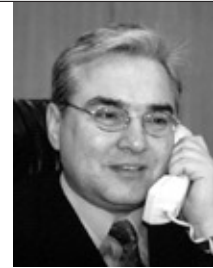
Валерій Пятницький Перший заступник Міністра економіки та з питань європейської інтеграції України

Ми сподіваємось, що візит данської бізнесової делегації покладе початок новим діловим зв'язкам і новим цікавим проектам. Обсяги прямих інвестицій із Данії сягають 1% від загального обсягу вкладень в Україну, що становить близько 67 млн. дол. США. Данські фінансові ресурси вкладені в 72 українських підприємства, 24 з яких є спільними.