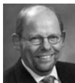
Біргер Піс Йоргенсен Голова Датської торгової ради Державний секретар, Посол

тел.: +45 3392 0000 факс: +45 3254 0533 www.eksportraadet.dk