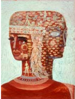
Imaginistiskt kvinno-huvud, dubbelporträtt, Gouache, 1946, © Malmö Konstmuseum