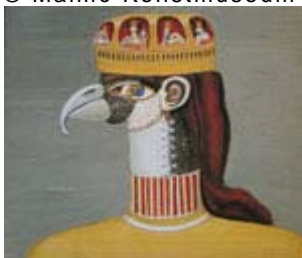
Imaginärt porträtt, Gouache 1945