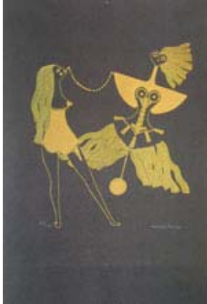
Oförnuftets stjärnor, litografi till Rimbauds "Illuminastioner", 1957 © Malmö Konstmuseum