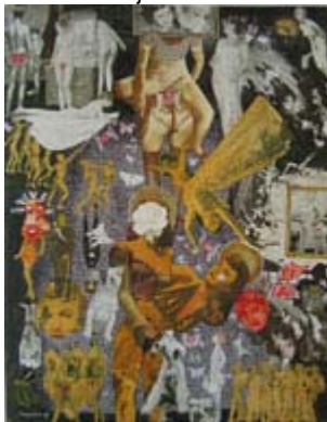
Tidsenlig satir II collage 1939 © Malmö Konstmuseum