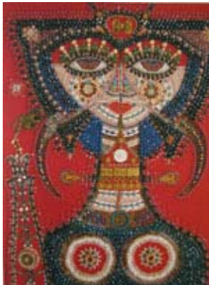
Porträtt av en stjärna III Pärlnosaik, 1957-58 © Malmö Konstmuseum