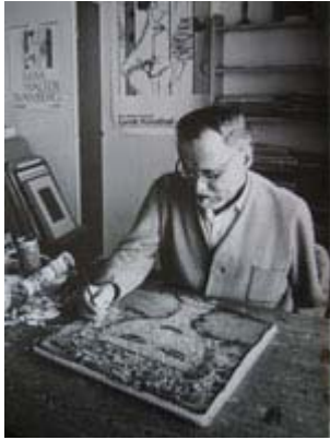
Max Walter Svanberg