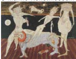
Nattens hjärta skrattar Teckning, 1948 © Malmö Konstmuseum