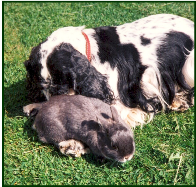
Kani tottuu myös muihin eläimiin.

Ystävyys ei välttämättä synny ensitapaamisella eikä toisellaakaan. Se voi vaatia viikkoja jatkuvaa päivittäistä tutustuttamista eikä kenenkään maalla. Myös rakkaus ensisilmäyksellä on mahdollista, vaikkakin valitettavan harvinaista.