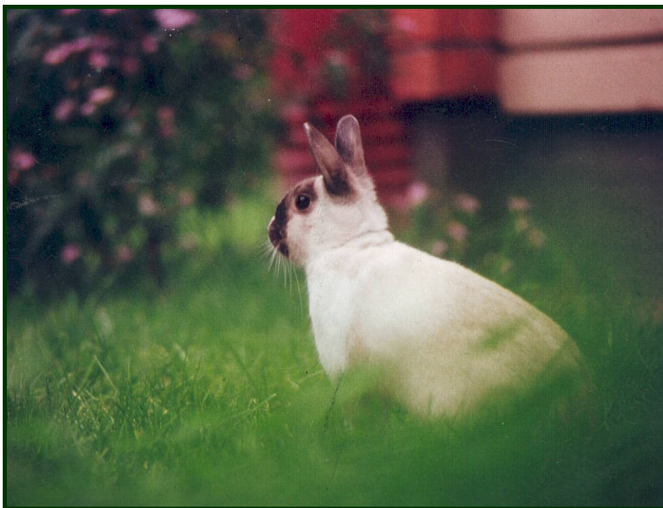
Kani tarkkailee reviiriään puutarhassa

Kanit pitävät heinän mutustelusta ollessaan vessassa. Kun vessan kuivikkeet vaihdetaan vähintään joka toinen päivä, on vessaheinän syönti täysin sallittua. Puhtaus suojelee kania ripulilta. Kanijätteet voi valistunut omistaja mainiosti kompostoida.