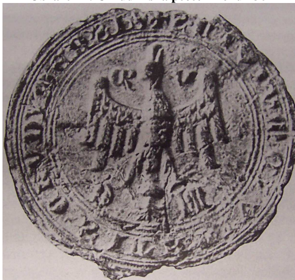
Obrázek 1: Chrudimská pečeť z roku 1362