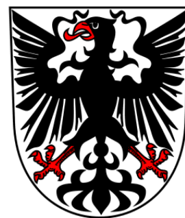
Obrázek 5: Současný městský znak

Oficiální prapor Chrudim nikdy neměla. Až v roce 1991 začaly práce na vexilologicky (vexilologie - věda o praporech) správné podobě městského praporu. Rada města (tehdy Městská rada) vybrala jeden, který vycházel ze správného městského znaku, což je první vexilologická zásada. Barvy města vycházejí z heraldických prvků městského znaku.