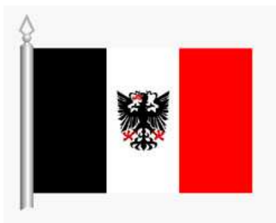
Obrázek 4: Současná vlajka města

Na počátku 90. let 20. století došlo k ustálení podoby městský symbolů - znaku a vlajky. Rozhodnutím předsedy České národní rady z 12. února 1992 byla Chrudimi udělena vlajka v podobě listu tvořeného třemi svislými pruhy, černým, bílým a červeným, v bílém pruhu je černá orlice s červenou zbrojí a jazykem. 19