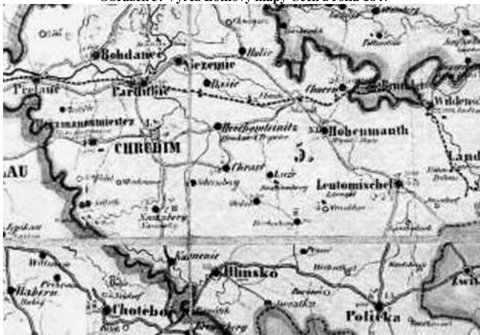
Obrázek 3: Výřez Lothovy mapy Čech z roku 1847