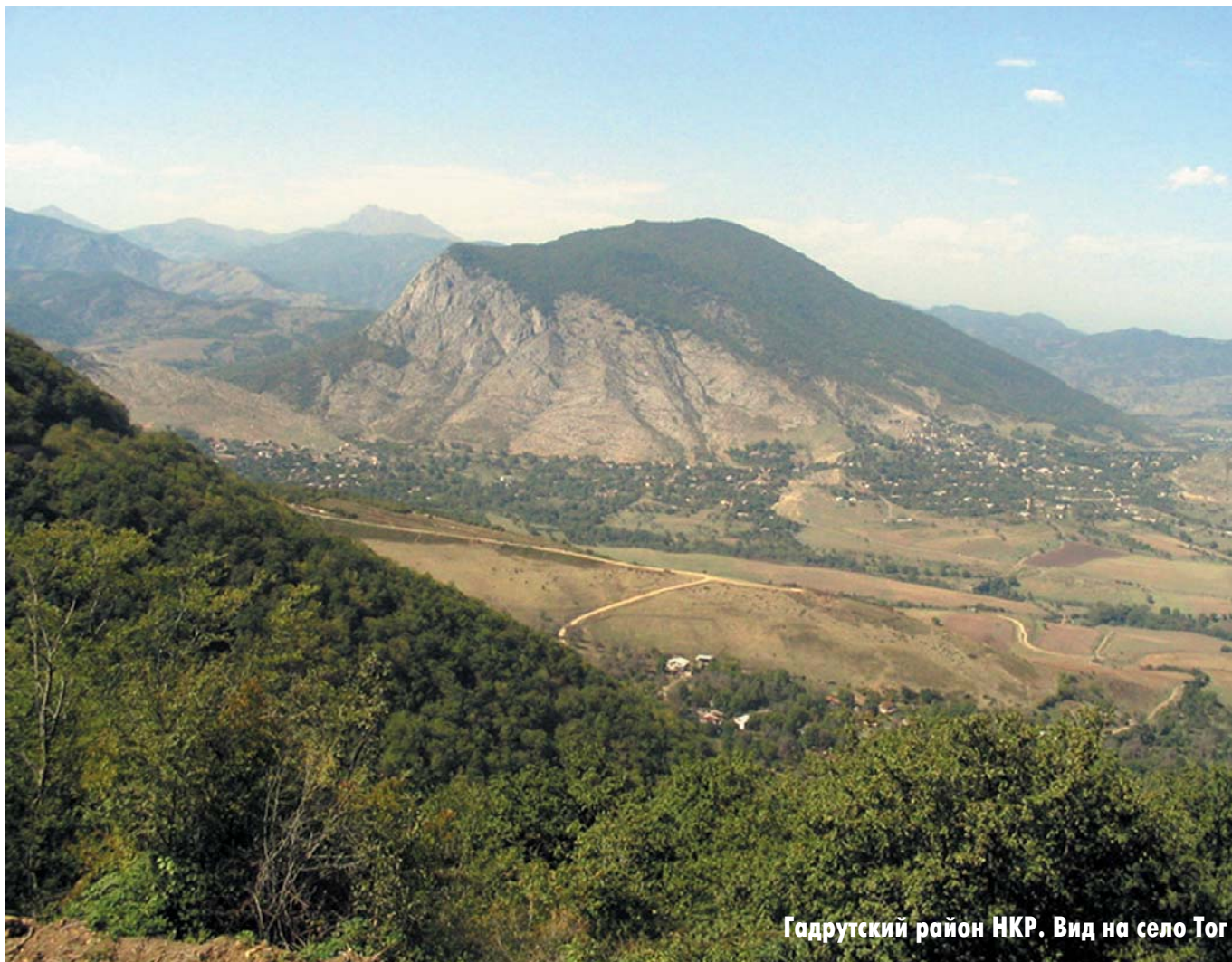
Гадрутский район НКР. Вид на село Тог

— Жарко, — картинно заявили мы, — и по очереди стали подставлять головы под родниковую струю. Но и это не помогло. «Контакт» не состоялся. Люди по-прежнему молча и настороженно продолжали смотреть на нас. А к нам в это время направлялся среднего роста, подтянутый, крепкий сухощавый человек лет тридцати-тридцати пяти.