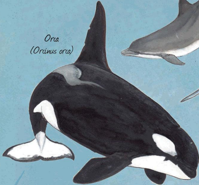
Orca ( Orcinus orca )