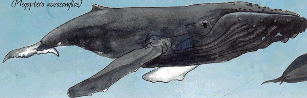
Yubarta ( Megaptera novaeangliae )