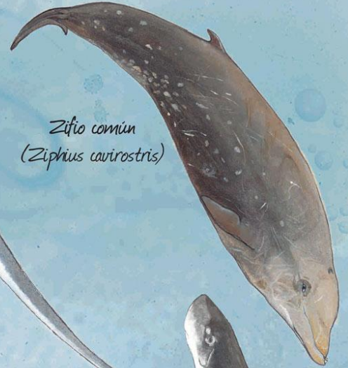
Zifio común ( Ziphius cavirostris )