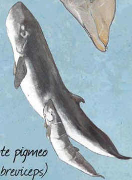
Cachalote pigmeo ( Kogia breviceps )