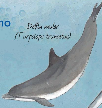
Delfin mular ( Tursiops truncatus )