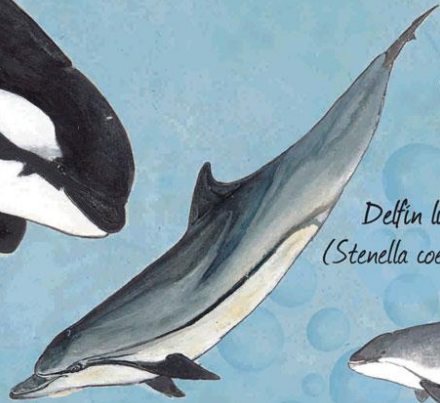
Delfin listado ( Stenella coeruleoalba )