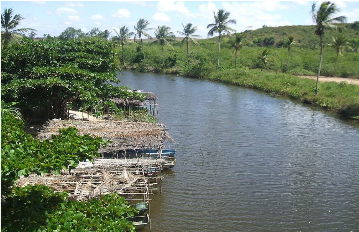
Figura 03 - Vale do rio Cotinguiba no município de Laranjeiras. Credits: Helio Mário e Wellington Villar, 2007.

justifica-se também, pelo fato de o canal apresentar índice superior a 1.04, relação estabelecida entre o seu comprimento e o comprimento do eixo.