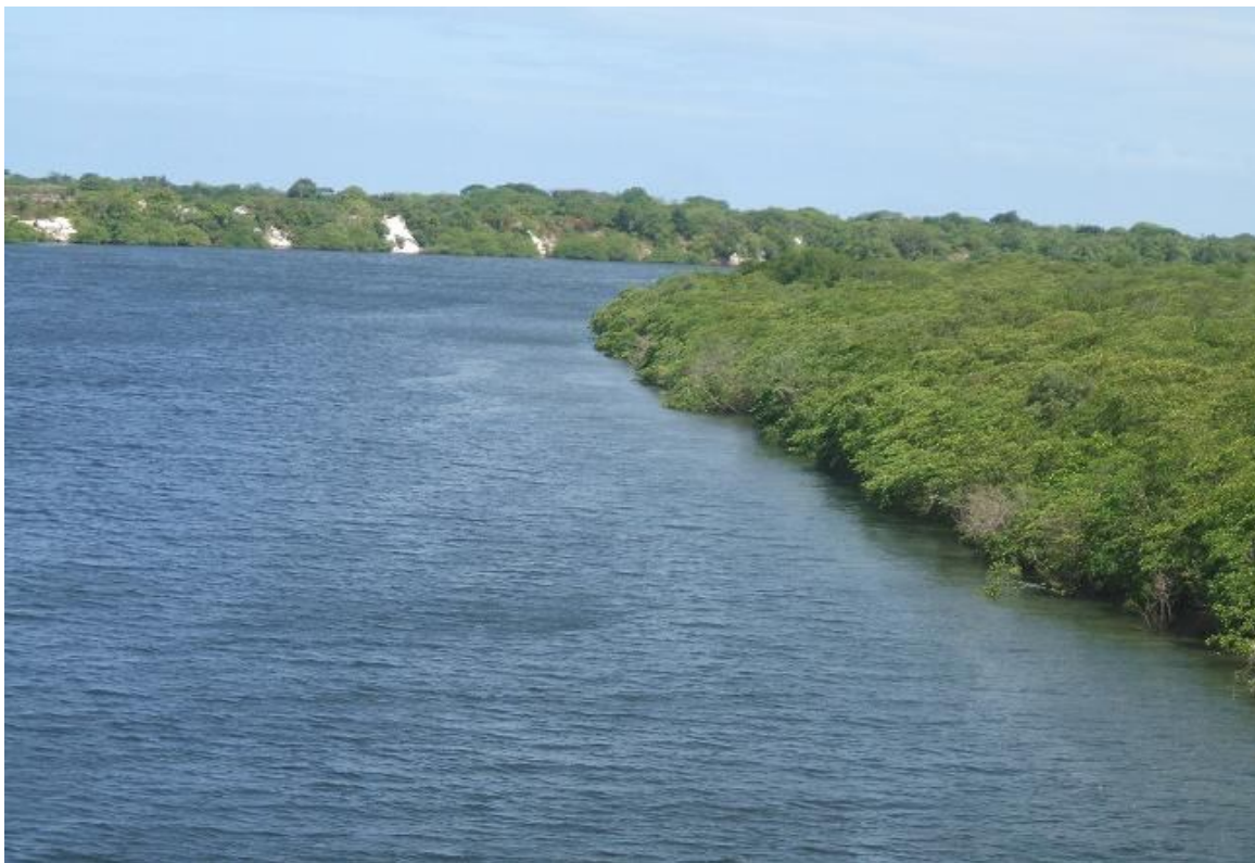
Figura 04 – Rio do Sal nas imediações da ponte que dá acesso ao Conjunto João Alves Filho em Nossa Senhora do Socorro/SE.

A calha desse rio, nos trechos médio e baixo, exhibe uma tipologia determinada, principalmente, pela variabilidade das marés cuja influência se estende a cerca de 15km ao longo do seu curso, a partir do ponto de sua desembocadura no rio Sergipe, onde drena uma área de aproximadamente 62,58km 2 .