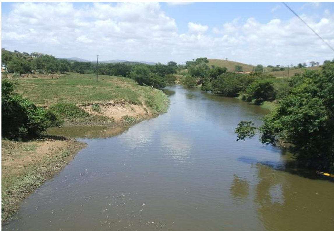
Figura 02 – Rio Sergipe nas proximidades do município de Riachuelo/SE. Créditos: Hélio Mário e Wellington Villar, 2007.