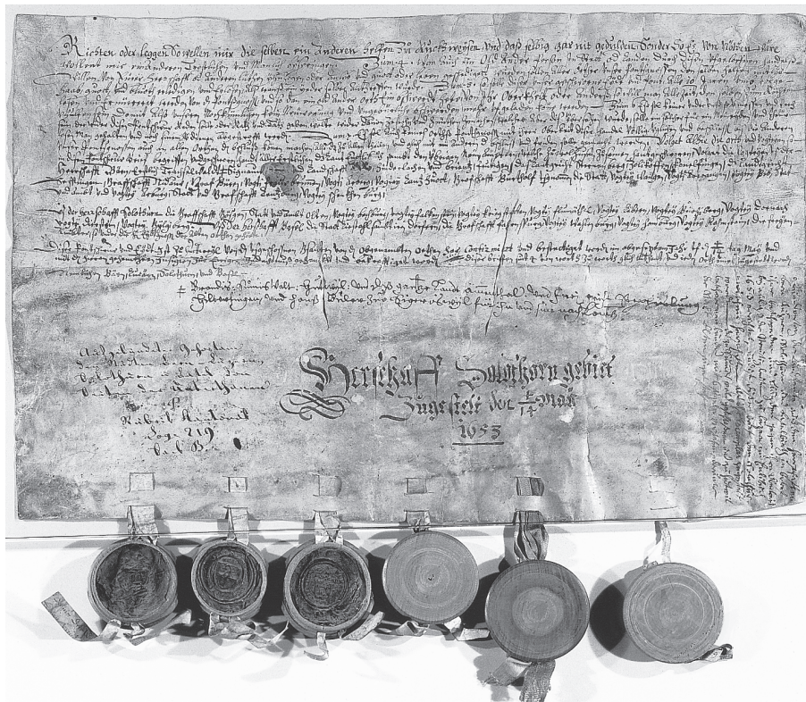
Abb. 3 Rückseite des Bundesbriefes von Huttwil vom April/Mai 1653 (vgl. Umschlagbild). Die dunklen Flecken sind Spuren einer nachträglichen Korrektur an der Urkunde. An zwei Stellen wurde der ursprüngliche Text mit einem Messer weggekratzt, um die geografische Herkunft der Teilnehmer des Bundesschwures zu präzisieren. Diese Korrektur zeugt von der Anspannung und Hektik innerhalb des Bauernbundes, der sich damals auf eine kriegerische Auseinandersetzung mit der Obrigkeit vorbereitete.

fes, hier Seite 32f., sowie die Anmerkungen 54ff. zur Transkription). Zweitens ist ebenfalls im Nachhinein mit Hilfe eines Verweissymbols und einer entsprechenden Ergänzung an unpassender Stelle die Beteiligung mehrerer Emmentaler und Oberländer Ämter, Gerichte und Einzelpersonen hinzugefügt worden. Die beiden nachträglichen Bearbeitungen sind angesichts der im Übrigen sorgfältigen, geradezu kanzleimässigen Ausfertigung der Dokumente bemerkenswert. Wir dürfen darin wohl Indizien für die Anspannung und Hektik sehen, die in der Phase der Mobilisierung und der Entstehung des Bundes Ende April und Anfang Mai 1653 unter den Aufständischen herrschte. Die Tatsache, dass in der beglaubigten Kopie des Bundesbriefes vom 9./19. Mai 1653 aus der Feder von Johann Konrad Brenner, des Schreibers der bernischen Untertanen, die Ergänzungen bereits korrekt in die Abschrift eingefügt sind und hier auch jeder Hinweis auf eine Teilnahme der Thuner fehlt (Staatsarchiv des Kantons Bern, A IV 183, Allgm. Eydgnößische Bücher, Baurenkrieg 1653, D, 249–260), legt es nahe, die Ergänzungen beziehungsweise Rasuren auf den Originalurkunden in die Zeit zwischen dem 4./14. und dem 9./19. Mai 1653 zu datieren.