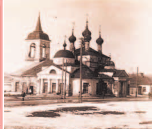
Храм Свв. Жен Мироносиц. 1685 г.

ховским княжеством и вообще с отечественной историей». Эта книга, не утратившая научного значения и сейчас, недавно переиздана и продается в киоске Серпуховского историко-художественного музея.