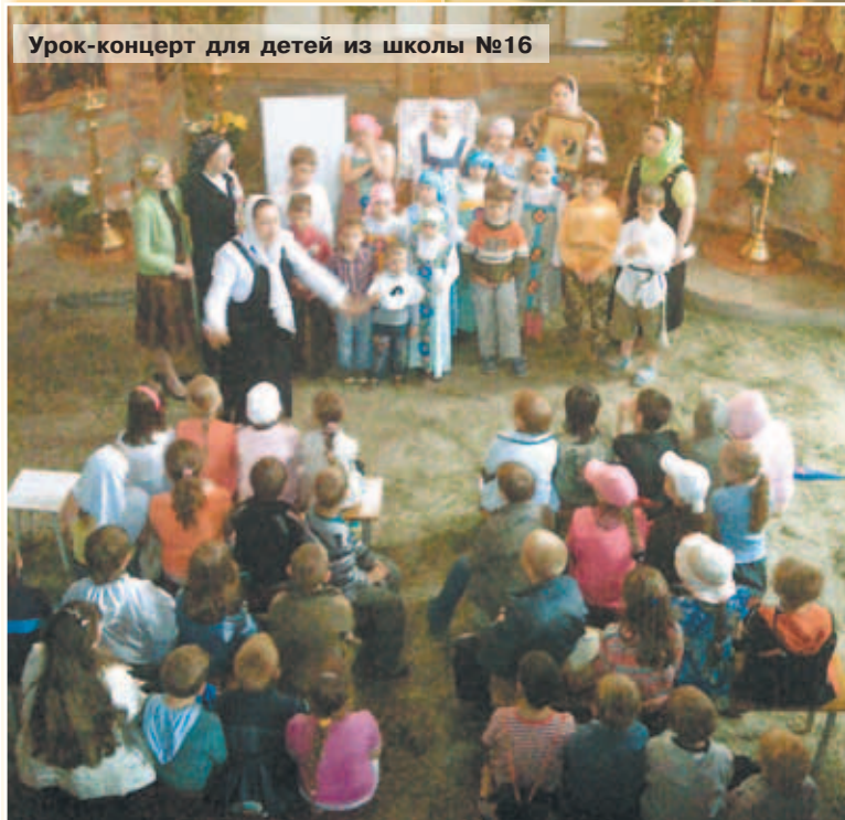
Урок-концерт для детей из школы №16

го лагеря «Спасский цветник» играли в нее очень увлеченно: два игрока, вооруженные крючками, должны были по очереди растащить кучку деревянных деталей так, чтобы они не раскатились в разные стороны.