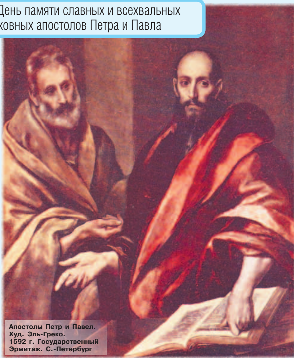
Апостолы Петр и Павел. Худ. Эль-Греко. 1592 г. Государственный Эрмитаж. С.-Петербург

Значит, апостолы Петр и Павел именуются первоверховными не за преимущество перед другими во власти, а лишь по чести. За что же им такая особая честь? За их великие труды. Все святые апостолы понесли множество трудов в благовестии Христова учения, но эти двое потрудились больше всех (1 Кор. 15, 10). Переходя из города в город, из страны в страну, святые Петр и Павел везде рев-