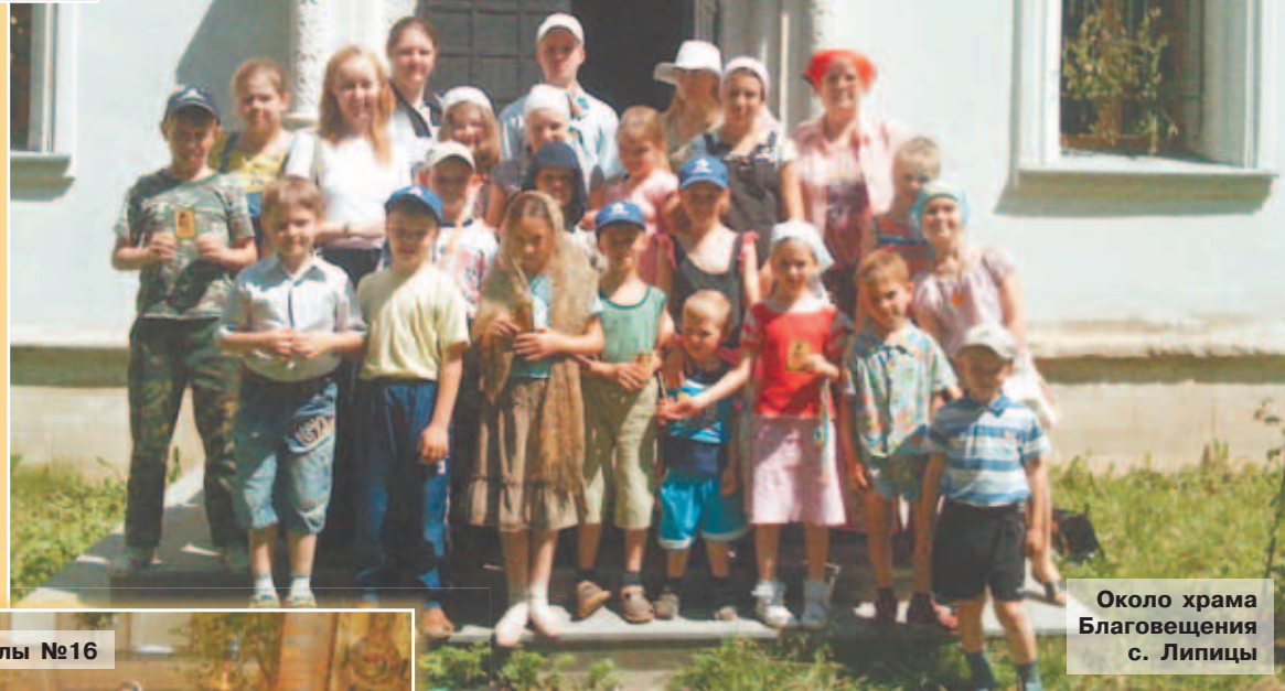
Около храма Благовещения с. Липицы

Педагоги лагеря руководствуются в своей деятельности... православным учением о трехоставности человека, которое точно и кратко объяснил святитель Феофан Затворник: «Человек имеет не только тело, но и душу, и в своей внутренней жизни - не только душу, но и дух, который несравненно выше души. Каждая из этих частей существа человеческого - тело, душа и дух - имеет свои потребности. Первое - плотское ищет земных; второе - душевное ищет благодетельских, или благ мира;