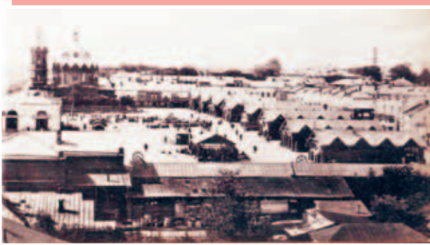
Главная площадь. Вид с юго-востока