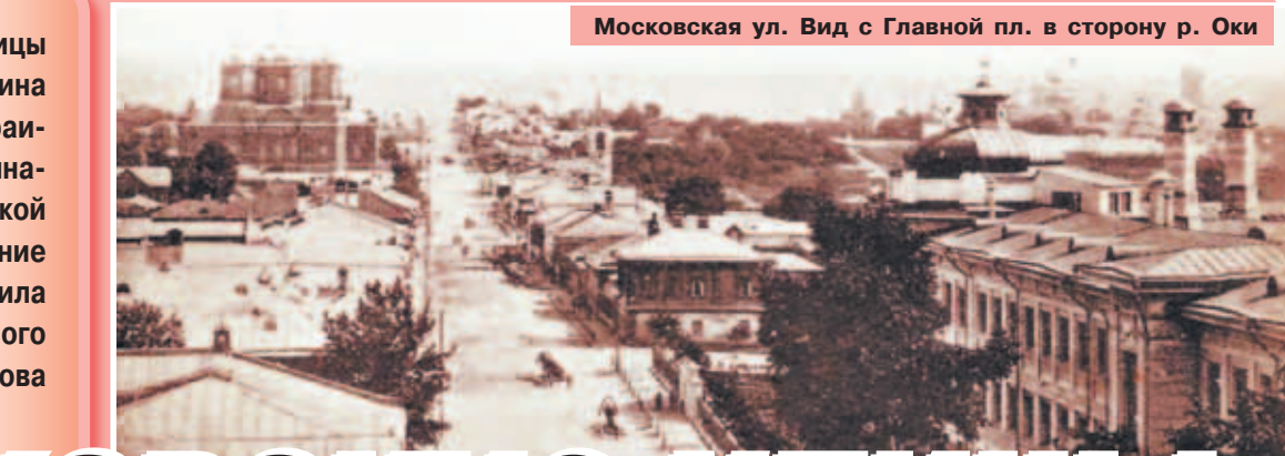
Московская ул. Вид с Главной пл. в сторону р. Оки