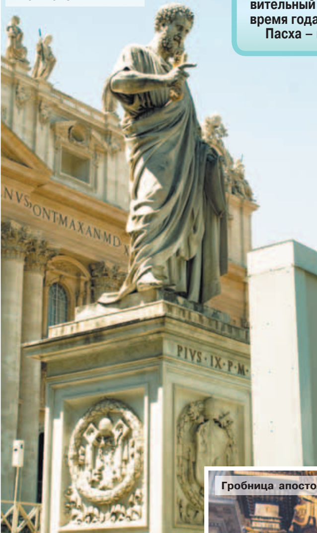
Статуя апостола Петра в Ватикане

Только четыре церковных праздника удостоились чести иметь подготовительный период поста, и каждый из них как бы освящает собой свое время года: Успение Богородицы – осень, Рождество Христово – зиму, Пасха – весну, а праздник святых апостолов Петра и Павла – лето