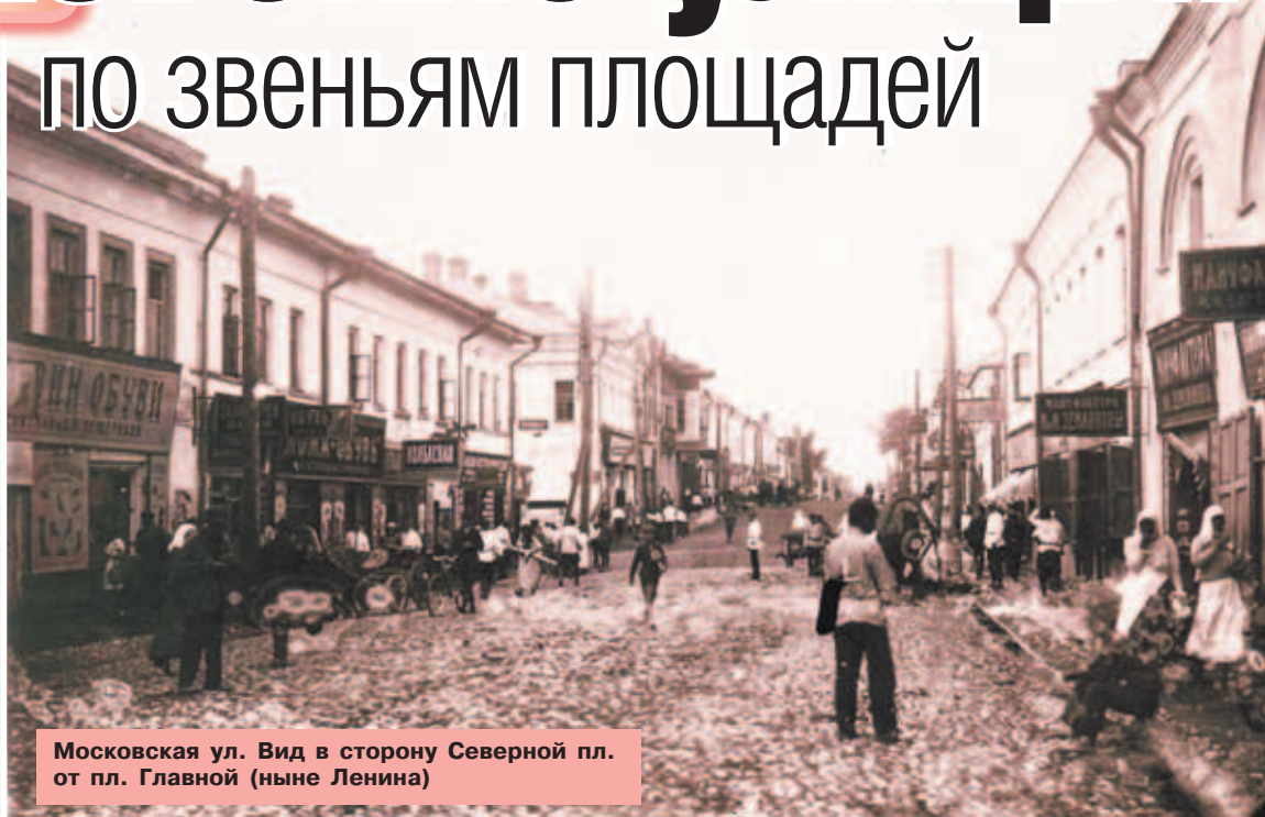
Московская ул. Вид в сторону Северной пл. от пл. Главной (ныне Ленина)