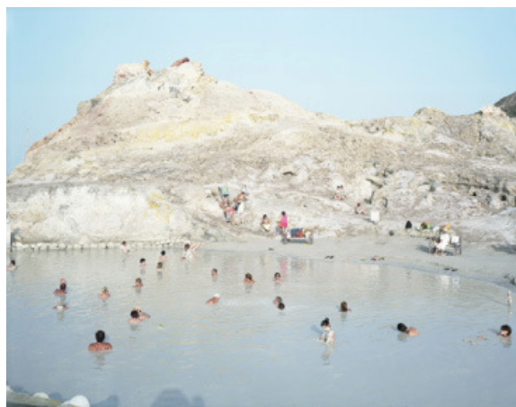
"#3245, Vulcano Mud-cettina", Capricci , Sicily, Italy, 2008 Tirage numérique couleur, 220x180 cm

His latest pictures were taken in Sicily, Turkey and St Wolfgang Lake, Austria. These photos recall the traditional capricci landscape paintings (frivolous, playful pastoral scenes) of the 18th century - linked here to our contemporary focus on leisure. Vitali devotes months to finding the ideal locations with the perfect elements: the dramatic rock formations and ancient ruins and villages that remind him of those paintings.