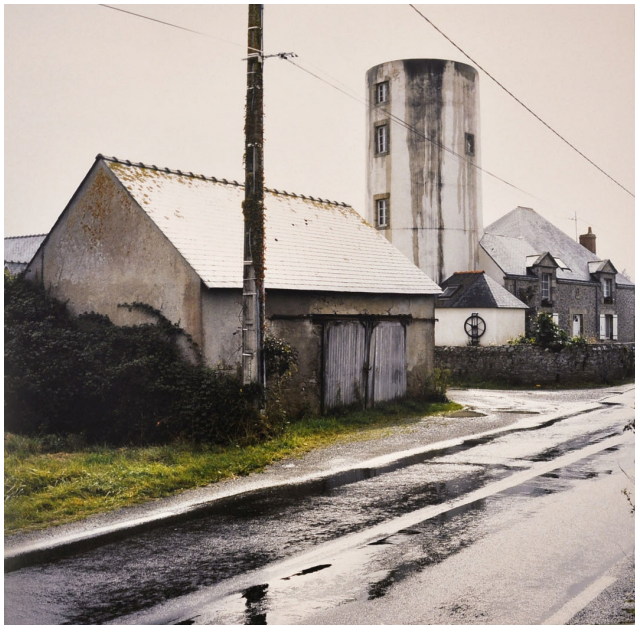
« La grande tour », 2008

(à venir) Novembre 2009/Janvier 2010, exposition collective « S x S dans R (4 e volet) » à la galerie Floralee, Paris 3 e (commissaire : Adrien Pasternak). Dans le cadre de cette exposition, présentation de la vidéo « Racines » (2009).