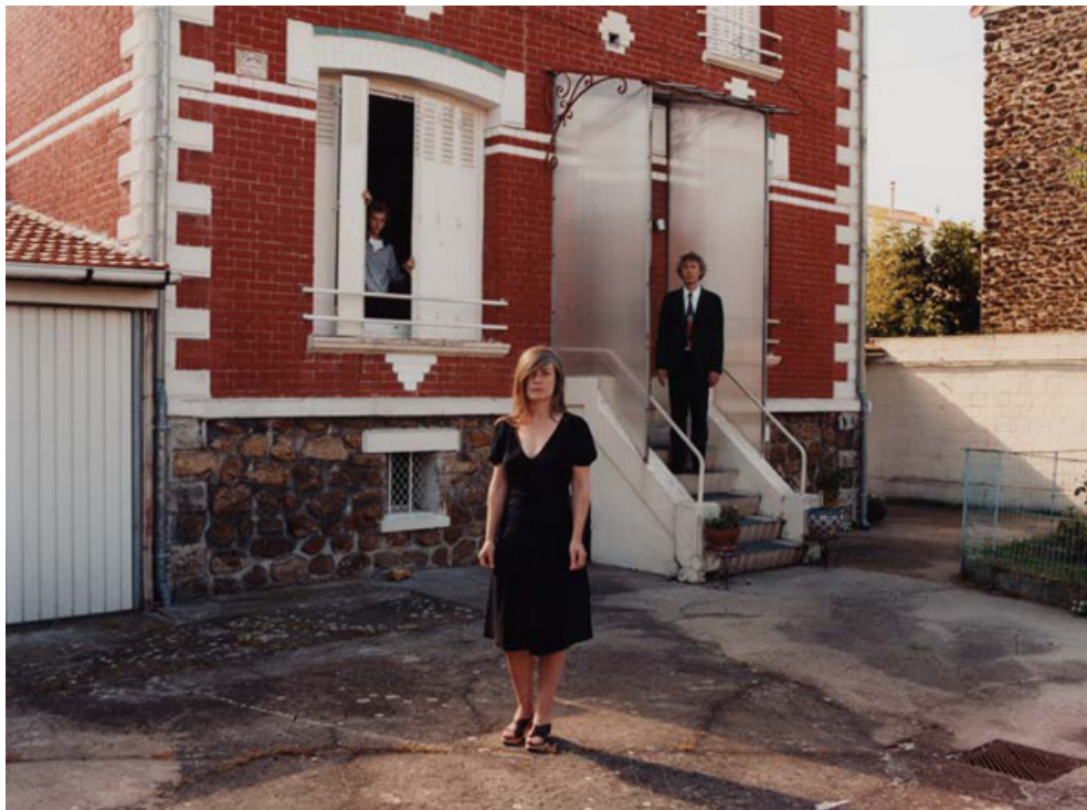
"Sans titre", La famille incertaine , banlieue, France, 2008 Tirage argentique, 75x90 cm

Il y a deux ans, je me suis installée à Fontenay-sous-bois. Plus motivée par une envie d'espace que par un réel désir de vivre en banlieue, j'allais devoir m'adapter à ce nouvel environnement. J'atterris dans ce qu'on appelle communément une zone pavillonnaire. Ce n'est pas la ville, c'est un monde singulier, une sorte de théâtre des familles. À l'heure du Grand Paris, c'est un endroit en pleine évolution : les maisons ouvrières ont perdu leurs ouvriers. C'est maintenant le cœur de la ville qui s'étend là et rapidement, j'y retrouvais mes pairs. À la différence de Paris, chaque maison offre une partie visible sur la rue et, pour la première fois j'avais accès à une sorte d'intimité familiale. Petite fille élevée dans l'idée d'un bonheur indiscutable, je me retrouvais confrontée à mes propres questionnements sur la famille. Alors comme dans un laboratoire, j'ai eu envie d'explorer : forger des situations, provoquer des moments de solitude et d'intimité, retenir les personnages dans un espace quadrillé et les laisser se débattre avec le lien familial.