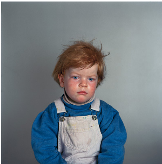
Untitled #1, from the series A disenchanted Playroom “, 2006.

Après un moment il commença à occuper mes pensées de manière si précise que j’ai décidé de me pencher sur la question afin de comprendre ce qui m’avait tant fasciné. En reprenant la même perspective que cette image que j’avais gardée en tête, j’ai réalisé les portraits. Seul l’espace de travail, le fond et la lumière étaient différents. Dans ce nouvel espace il était important de mettre l’attention du spectateur sur l’expression faciale des enfants. Je n’ai pas voulu les préparer mais les montrer aussi naturellement que possible quelques uns avec leurs vêtements sales qui venaient de jouer avec les cheveux décoiffés. Dans ces portraits il était important de souligner le moment précis où les enfants perdent toute expression d’émotion dans l’abandon le plus total d’eux-mêmes face à la télévision même lorsqu’il regarde des programmes pour la jeunesse. Loin de vouloir diaboliser la télévision ainsi que ses possibilités cela révèle pour moi à ce moment précis le désenchantement du monde pour ces enfants.