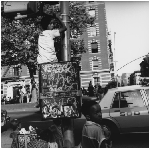
112th street , 1992

Sue Kwon is a photographer who has been relentlessly documenting the streets and denizens of New York City since 1983. Early commercial clients included The Village Voice and the nascent Paper and Source magazines. Portrait sessions and video shoots with some of rap music's finest followed, and soon labels including Def Jam, Sony, and Loud Records were commissioning her distinct photographs. While much of her current work focuses on her own projects, she still shoots campaigns for companies such as Burton Snowboards, Gravis, and A Bathing Ape. Kwon lives in downtown Manhattan.