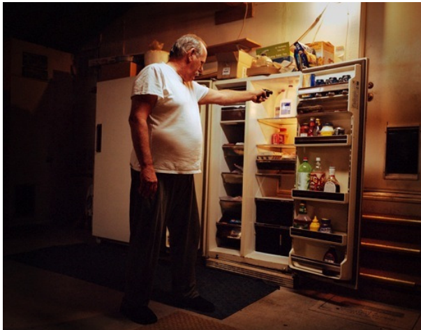
« Berger, live », Triangle element , 2007 Tirage numérique couleur, 50x16cm

Gooding continues to publish short run books, most recently "nineteen hours and fourteen minutes", a collaboration with the filmmakers of slumdog millionaire.