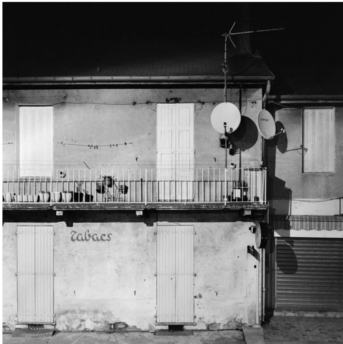
“ Sans titre”, Sols mineurs , 2006

Tirage jet d'encre papier fine art, 100 x 100 cm