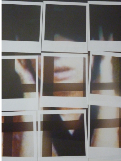
Shadow Pola, 2009

Ce qui lui a permis d'apprendre à travailler son œil photographique à travers le hip-hop, le monde de la nuit et la mode.