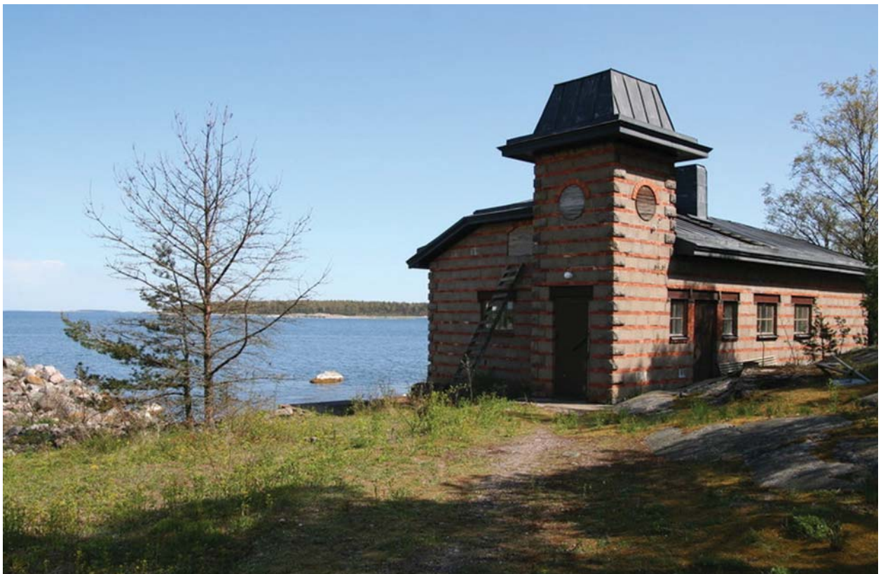
Kuivasaaren rantasauna.