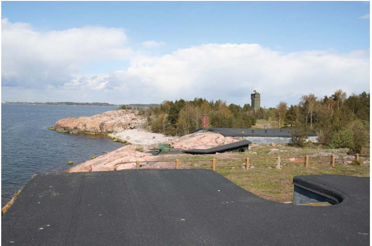
Kuivasaaren tulenjohtotorni.