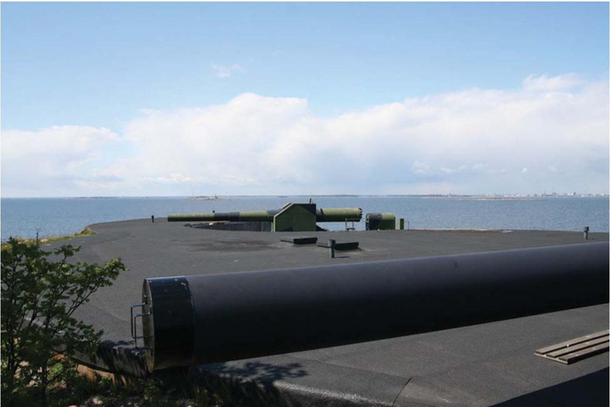
Kuivasaaren kaksoistornin toinen putki (305 mm) ja 254 mm:n tykki.