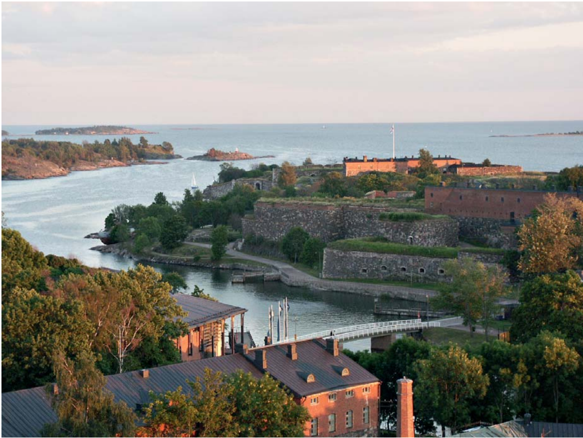
Näkymä Suomenlinnan kirkontornista.