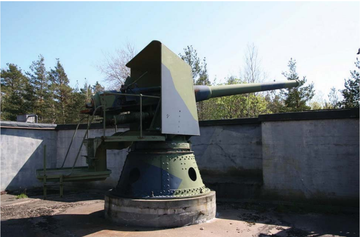
Tykki 152 45-C Kuivasaassa.