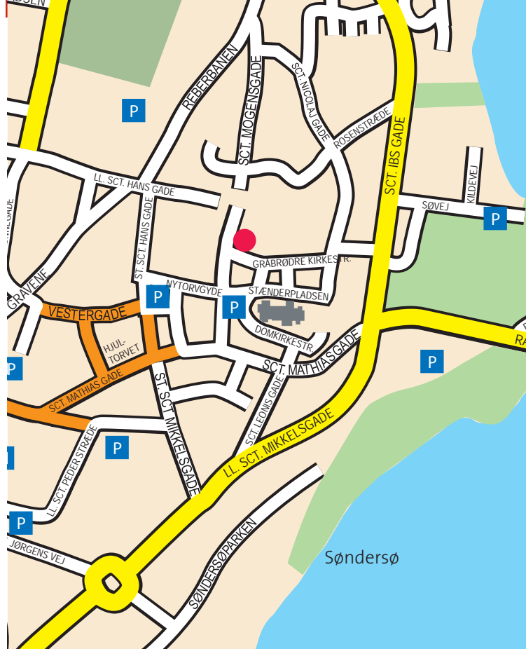
Hans Tausens Minde, Gråbrødre Kirke Stræde 1, 8800 Viborg

Hvor kirken lå, blev der i 1836 anlagt et haveanlæg, der blev indviet i anledning af reformationens 300 års jubilæum med opstilling af en mindestøtte for Hans Tausen, udført af billedhugger H. E. Freund fra København.