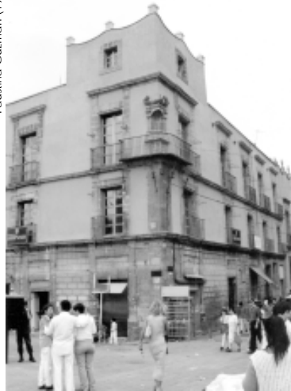
Edificio de la ExUniversidad , sede conservatoriana durante la segunda mitad del siglo XIX en las calles de Moneda y Seminario

Arqueología, en donde se alojó por más de treinta años.