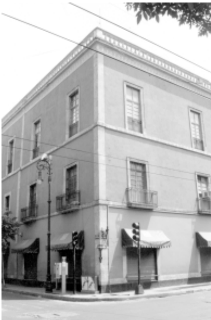
Esquina actual de Donceles y Allende, antes Canoa y El Factor , primera sede formal del Conservatorio (1866-1867)

Filarmónica Mexicana del edificio que había ocupado la Universidad de México, localizado en pleno Zócalo capitalino, es decir, en el cruce de las calles de Acequia y Universidad correspondientes a las actuales Seminario y Moneda, espacio en el que laboraría por más de cuarenta años la institución conservatoriana, prácticamente de 1867 a 1908.