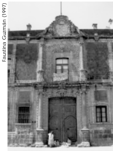
Faustina Guzmán (1997)

La biblioteca tenía dos saloncitos insuficientes para el gran número de estudiantes