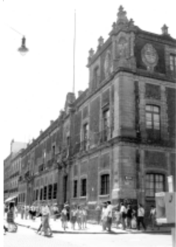
Casas del Mayorazgo de Guerrero en la calle de Moneda , sede conservatoriana de 1914 a 1947

que íbamos a buscar allí, no la fuente de sabiduría de sus volúmenes, sino refugio de las feroces prefectas, hasta que alguna risa indiscreta o un entusiasta juramento de amor sacaba de su habitual quietud a la bibliotecaria y éramos arrojados al inclemente mundo exterior.(1)