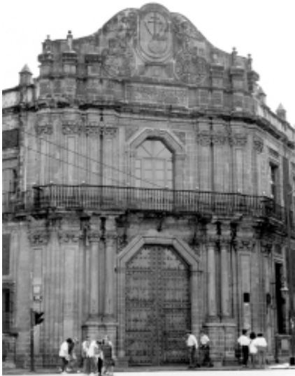
Edificio de la Antigua Escuela de Medicina y del Palacio de la Inquisición , en cuyo patio «de los Naranjos» se verificó el acto constitutivo del Conservatorio de Música de la Sociedad Filarmónica Mexicana (1866)

Allende. El problema fue que al aumentar la planta docente y la matrícula escolar, las instalaciones fueron insuficientes, máxime que a un año de haber sido fundado, el Conservatorio impartía nuevas asignaturas, entre las que destacaban Declamación, Gimnasia Sueca e Historia del País.