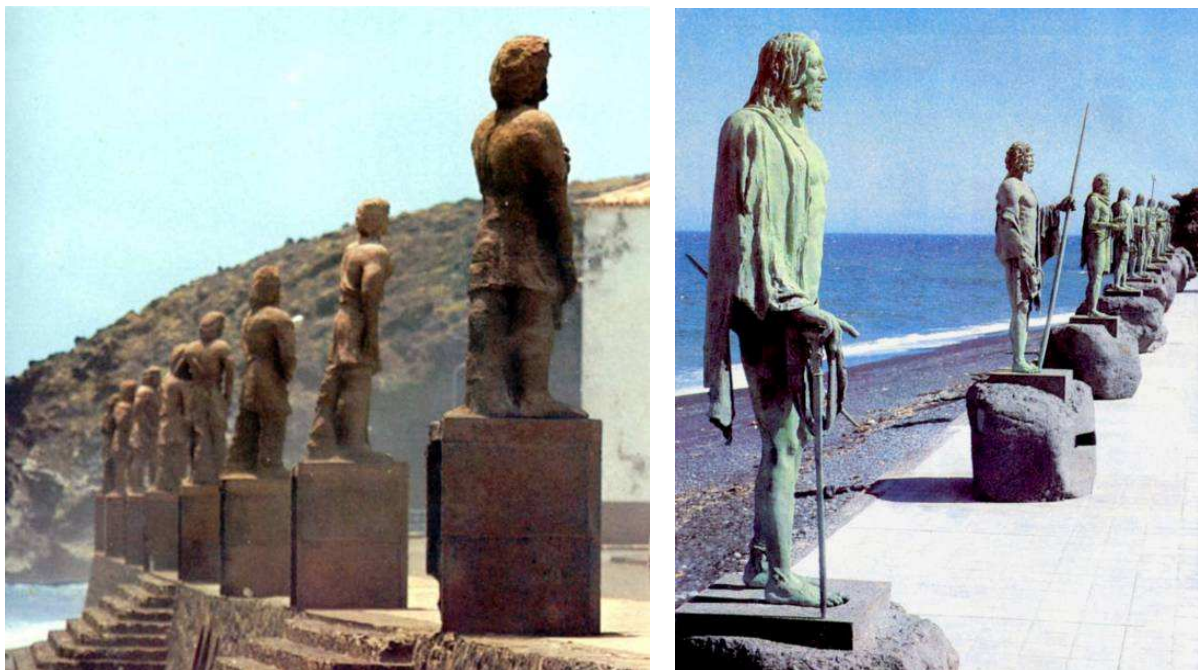
Conjuntos escultóricos de los Menceyes Guanches. A la izquierda el de Alfredo Reyes Darías (1959) y a la derecha el de José Abad (1993).