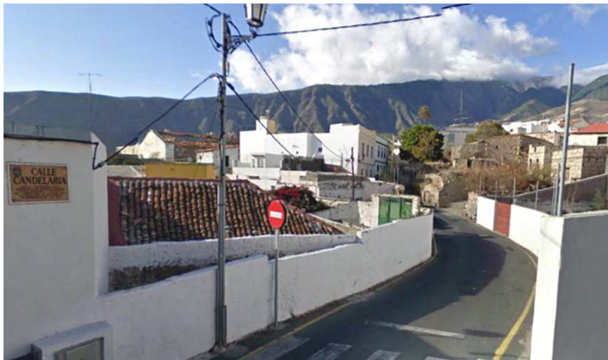
Calle Candelaria, en la ciudad de Güímar.

El 22 de julio de 1931, el Ayuntamiento de Güímar dio el nombre de Candelaria al tramo inicial del antiguo camino o “ Carretera Vieja ”, “ como expresión de aprecio al pueblo hermano de ese nombre y por ser parte del camino que con él nos une ”.