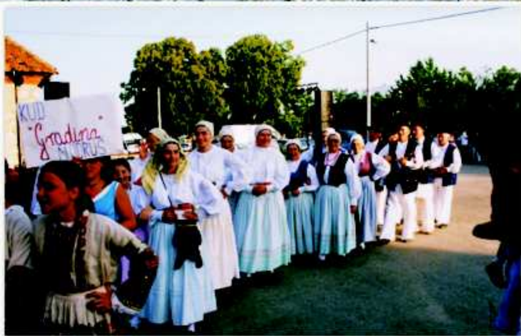
KUD "Gradina" za blagdan Sv. Ilije u Sincu