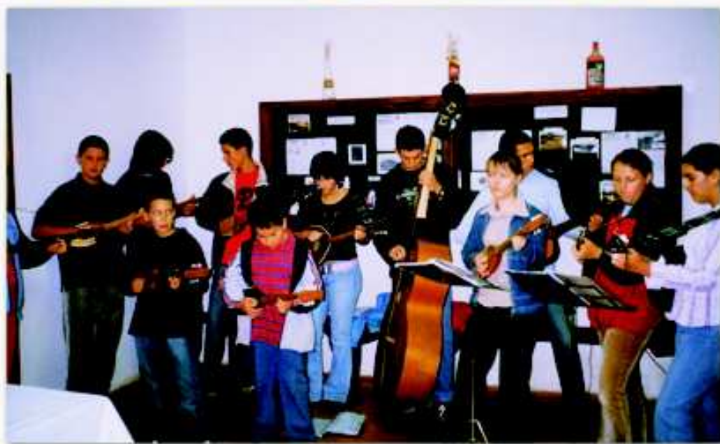
Mladi tamburaši društva "Naša djeca" iz Josipdola prigodom promocije "Panonskog ljetopisa"