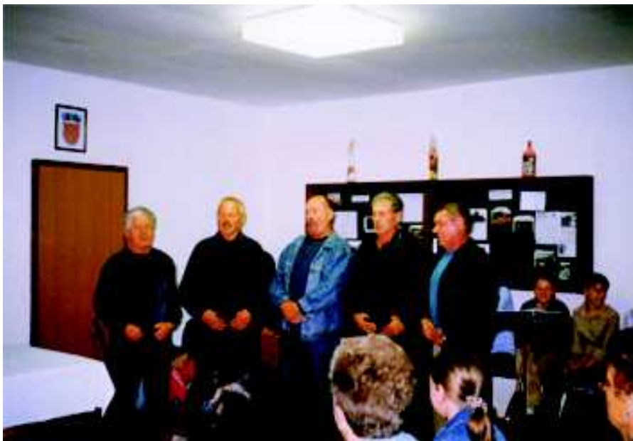
Muški članovi KUD-a na promociji "Panonskog zbornika" u Modrušu

Posebno treba pohvaliti muški dio KUD-a koji je nastupio na smotri u Generalskom Stolu a za većinu blagdana, na veselje i radost mještana, uveličavali su misna slavlja.