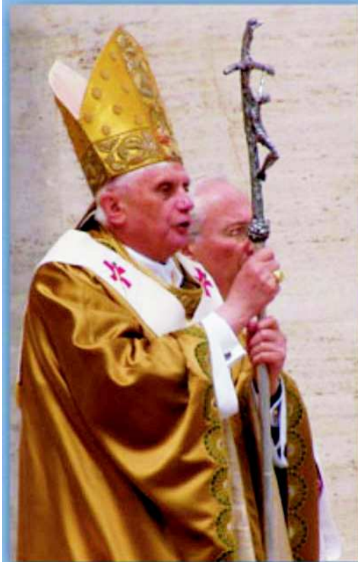
Papa Benedikt XVI, njemački kardinal Joseph Ratzinger