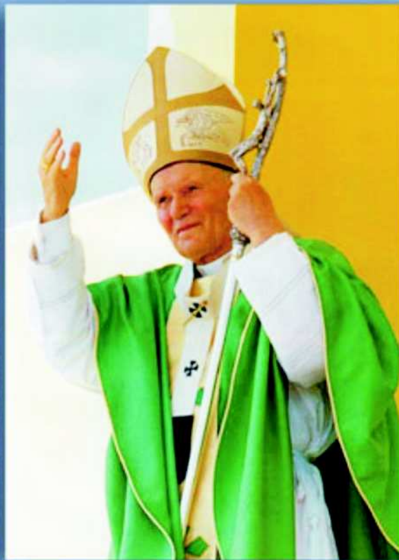
Vječni Bog pozvao je slugu svojega, Papu Ivana Pavla II u svoj dom u subotu 02. travnja u 21:37 sati