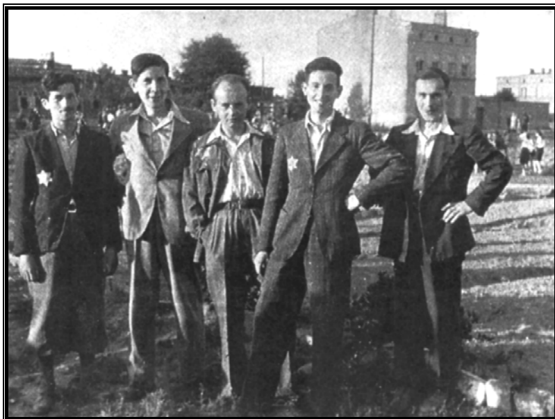
חברי גורדוניה בהכשרה במרישין