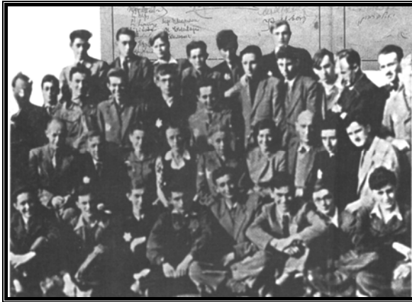
תלמידי הגימנסיה בגטו

"יום ראשון בבית הספר. הדרך למרישין ארוכה ובוצית בגלל הגשמים... הנעליים שלי, אותן קיבלתי בבית הספר, מתחילות להיקרע..."