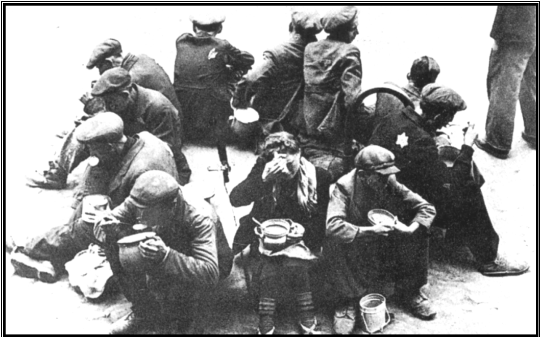
הפסקת צהריים באחת הסדנות בגטו

המטבח לאינטליגנציה הוא מעון טיפוסי של מי שהיו, של אנשים שתפסו אי פעם עמדות חשובות, חיו את החיים במלואם, והיום הושלכו מעבר לכל אלה. אם נביט על הלקוחות הקבועים של מטבח מספר 2 מנקודת ראות זו, רק אז נדע מה מעניק להם מטבח זה מלבד ארוחה."