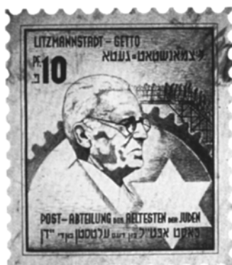
דיוקן רומקובסקי על בול שלהפצתו נאסרה

רומקובסקי עצמו האמין שכל עוד הגטו ימשיך לייצר ולהיות לתועלת לגרמנים וישמור את המסגרת של 'גטו יצרן' - על אף המחלות, הרעב, והתמותה הרבה, הוא ימשיך להתקיים. בנאומיו הוא מדגיש את החשיבות בעבודה והשקידה עליה. ואכן מבחר המוצרים שייצר הגטו היה מגוון מאוד, חייטות, מוצרי עור ופרוונות, מתכת, נייר, מברשות ועוד. אחד מהעובדים מספר שבגטו התבצע "כל סוג של עבודה - לכל בעל מלאכה היה מה לעשות" רומקובסקי השתדל להיות "בסדר" עם הגרמנים, למלא אחר פקודותיהם, ובמיוחד אחר פקודותיו של האנס ביבוב, המפקד הנאצי של המחנה, עליו נפרט בהמשך.