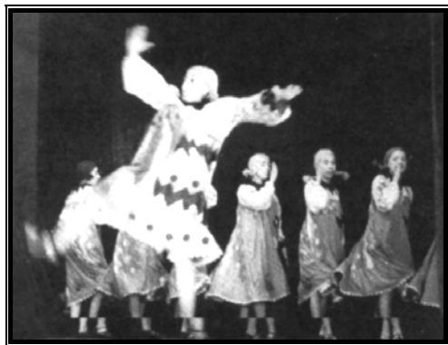
שחקני התיאטרון בגטו וקטעים ממחזות שהוצגו