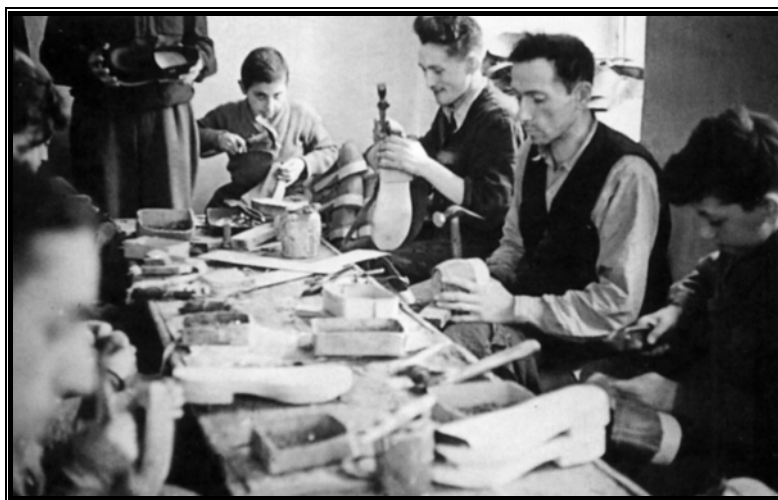
"בגטו יש לי 40 אלף ידיים עובדות. זהו מכרה הזהב שלי..." מתוך נאום של רומקובסקי [1.11.1941]

בבתי מלאכה מסוימים, כגון אלו של החייטים והסנדלרים, הונהגה שיטת סרט הנע, בתי מלאכה אחרים שייצרו מרבדים, קבקים, ומוצרים אחרים, העסיקו פועלים בלתי מקצועיים במספר רב: סוחרים לשעבר, נשים, קשישים, בני נוער ואפילו ילדים, רובם ככולם למדו את המקצוע תוך כדי העבודה. יחד עם זה, אנשים שהתמחותם היתה במקצוע שבגטו לא נמצא לו שימוש ניסו להשתלב במקצועות אחרים. לדוגמה - חייטי צמרת שהתמחו באופנה עילית בעבודת יד, ניסו להסתגל לתפירה הגסה שבמפעלים, כשלא הגיעו אליהם הזמנות למלבושים עליונים, עסקו בתפירת כותנות ומעילי פרווה עבור הצבא.