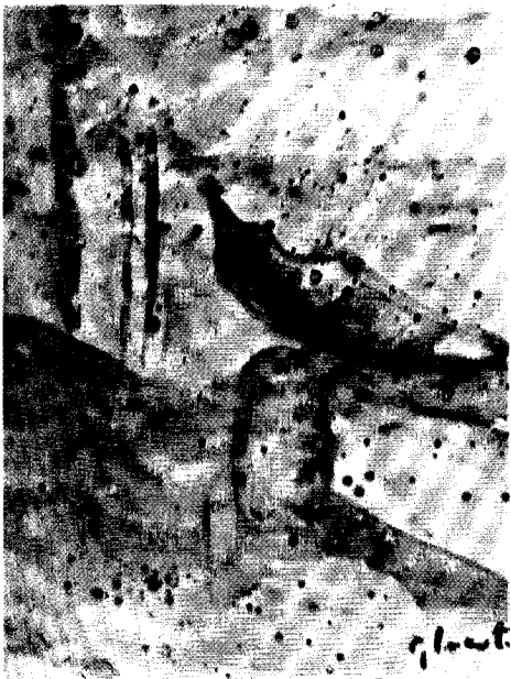
Giovanna Lacerti - Gondola sul canale