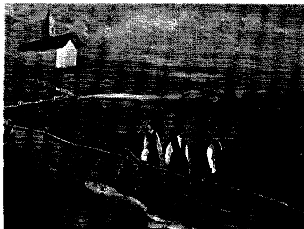
Giacomo Metta - Mattino domenicale

Il verismo di Metta è attuale, maturato nel senso della ricerca della pittura d'ambiente, con particolare riguardo alla vita contadina. La sua tematica si rinnova con ogni quadro per piegarsi alle espressioni di sfumature sentimentali o di acute realizzazioni ritrattistiche psicologiche.