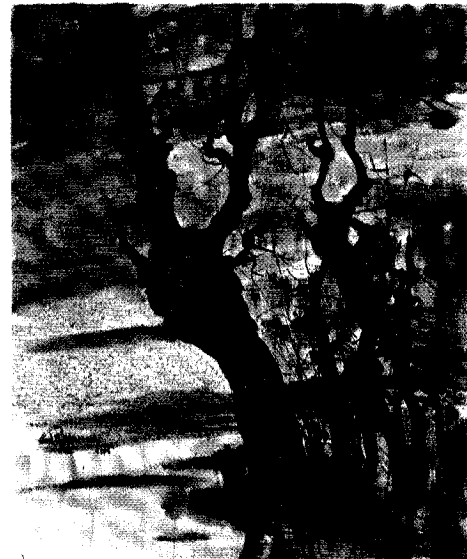
Romano Marradi - Paesaggio (affresco)