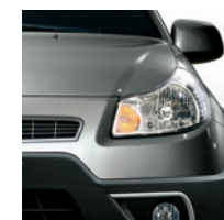
976 Grigio Pungente