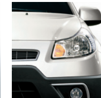
983 Bianco Acchiappanuvole