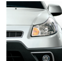
211 Bianco Cristallino