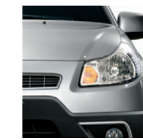
977 Grigio Ricercato