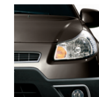
865 Grigio Caldo