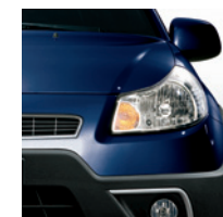
979 Blu Vertigine