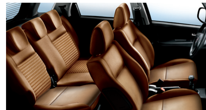
495 Pelle Cuoio