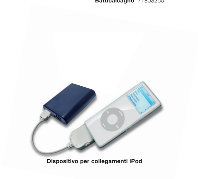
Dispositivo per collegamenti iPod