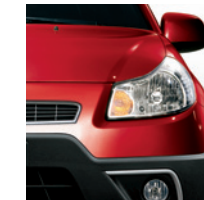
982 Rosso Brivido