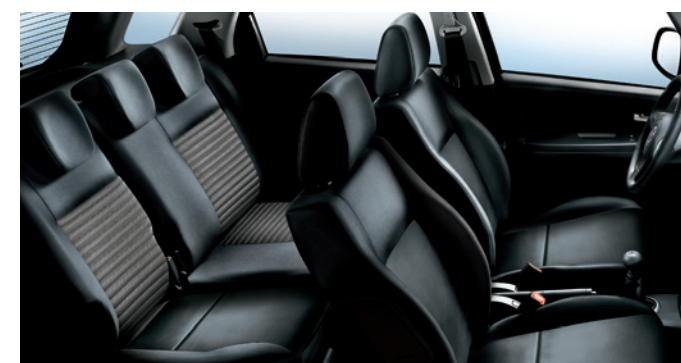
423 Pelle Nero