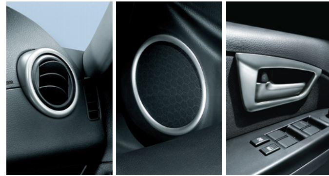
Cornici in alluminio 71803308