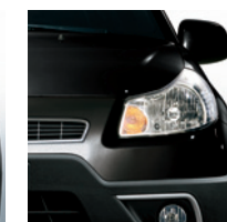
975 Nero in Splendida Forma