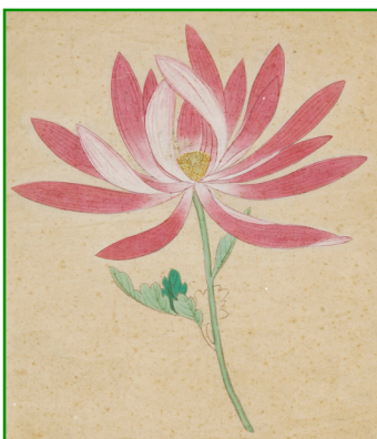
細川重賢筆 博物図譜草稿