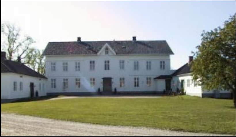
Over: Mæla i dag fra nord. Forrige side nederst, fra sør. Forrige side øverst, fra nord før ombyggingen i 1894