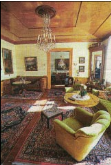
Fra Mæla i dag