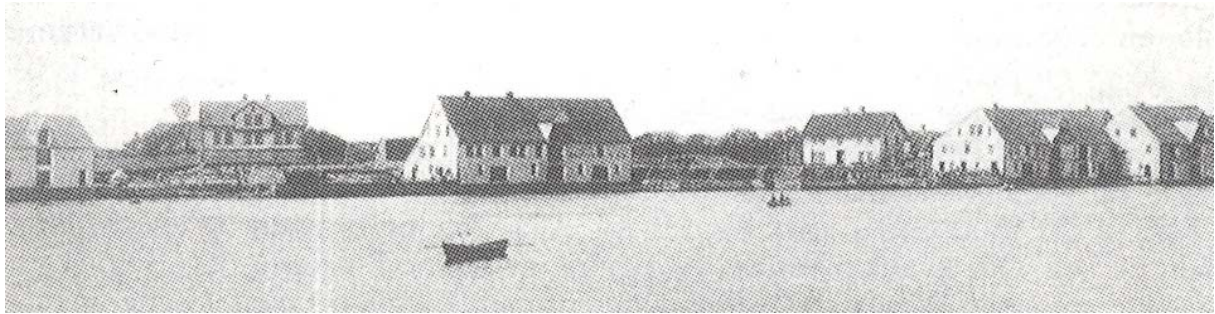
Vibrandsøy ca.1917 med Bergesen-huset i sentrum. Med unntak av sjøhuset lengst til høyre er bygningsmasse og landskap uforandret.